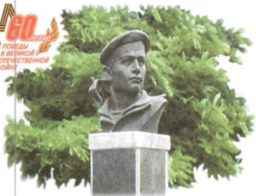
РОСТОВ-НА-ДОНУ. Бюст Героя Советского Союза, краснофлотца И.К. Голубия