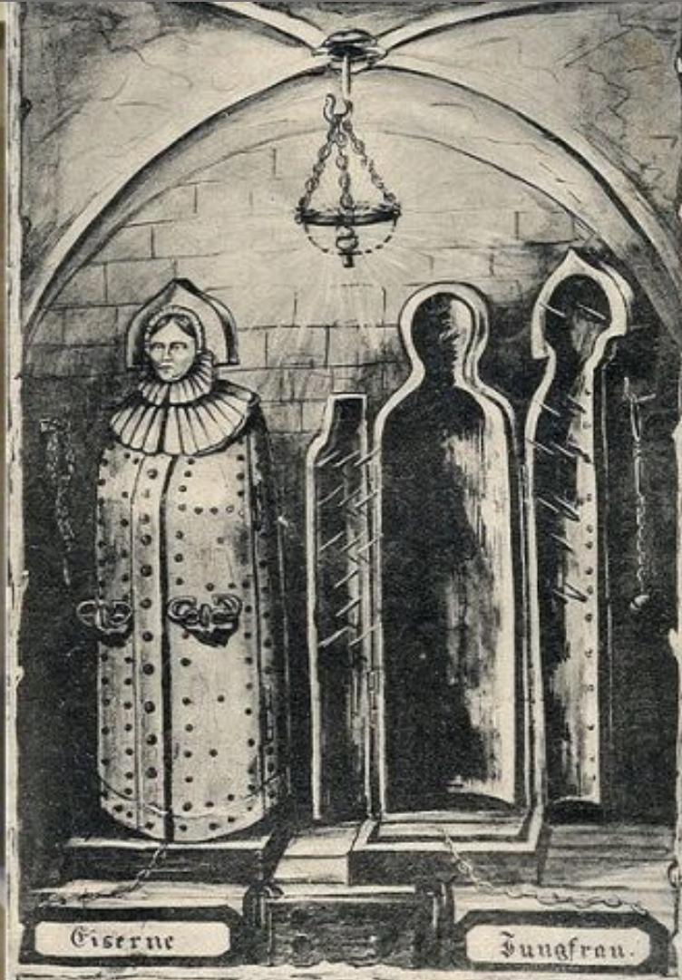
Nürnberg, Eiserne Jungfrau.