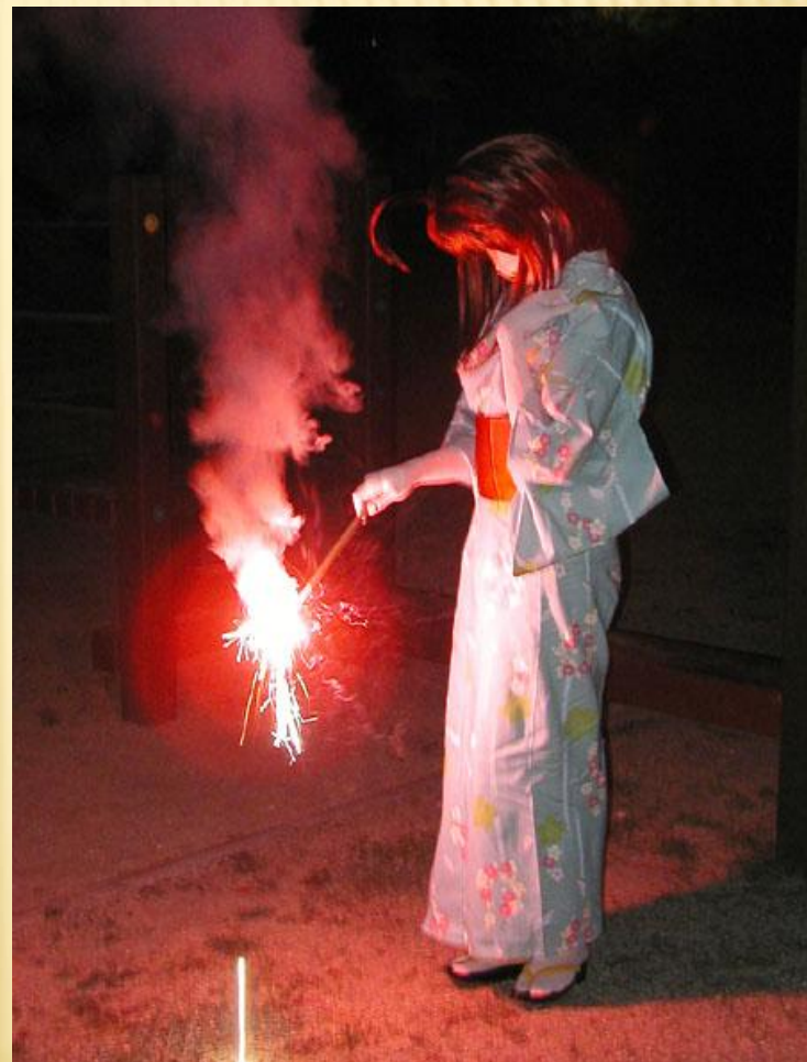
Юката-традиционный японский костюм