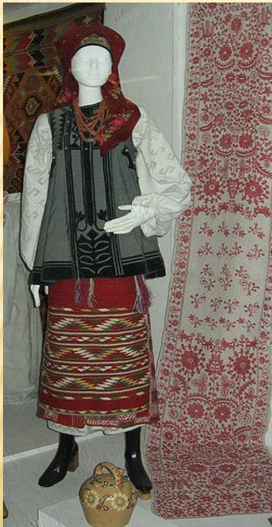
Женский центральноукраинский костюм

Костюм (от лат. costume) — может означать одежду в общем или отличительный стиль в одежде.