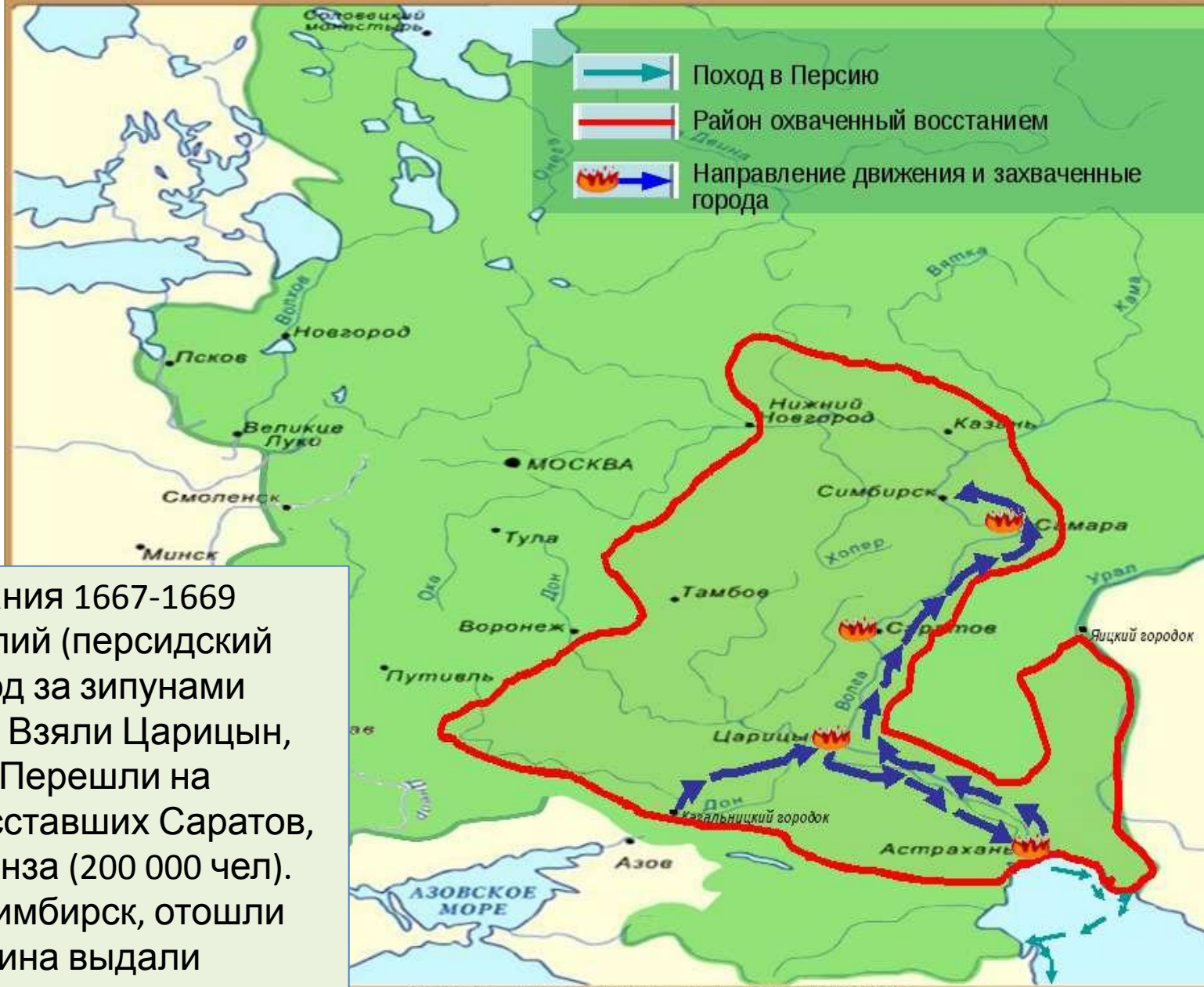
Карта «Восстание Степана Разина»

1-й этап восстания 1667-1669 (Волга, Каспий (персидский флот). Поход за зипунами 2-й этап – 1670. Взяли Царицын, Астрахань. Перешли на сторону восставших Саратов, Самара, Пенза (200 000 чел). Осадили Симбирск, отошли на Дон (Разина выдали властям, казнен). 1671г. Власти взяли Астрахань. убито до 100 000 чел.