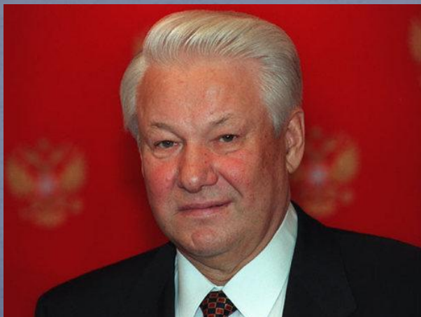
Б. Н. Ельцин первый президент России

К сожалению, ни на одном варианте не остановились.