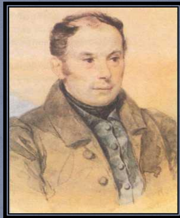
В. А. Жуковский

Светлопрелестная, Жизнь наднебесная, Сердцу известная, Сердцу сияй!