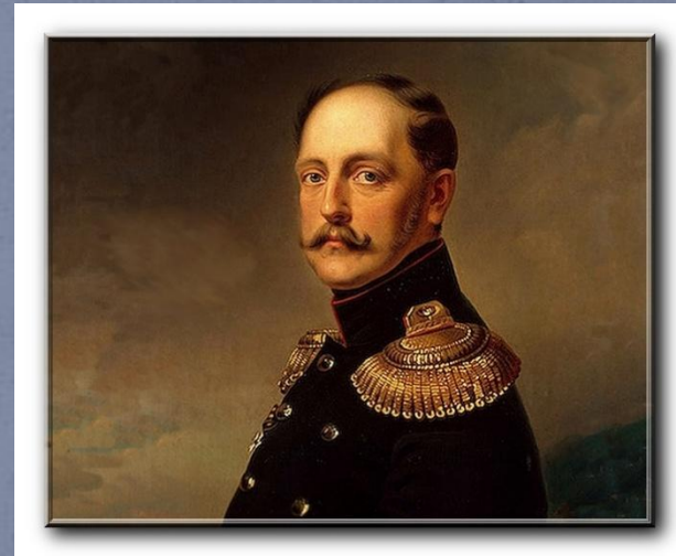
Николай I Павлович 1825-1855 гг.

Боже, царя храни! Сильный, державный, Царствуй на славу, на славу нам! Царствуй на страх врагам Царь православный. Боже, царя храни!