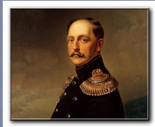
Николай I Павлович 1825-1855 гг.

Боже, царя храни! Сильный, державный, Царствуй на славу, на славу нам! Царствуй на страх врагам Царь православный. Боже, царя храни!