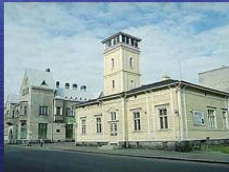
Сортавала. Карело- финская архитектура.