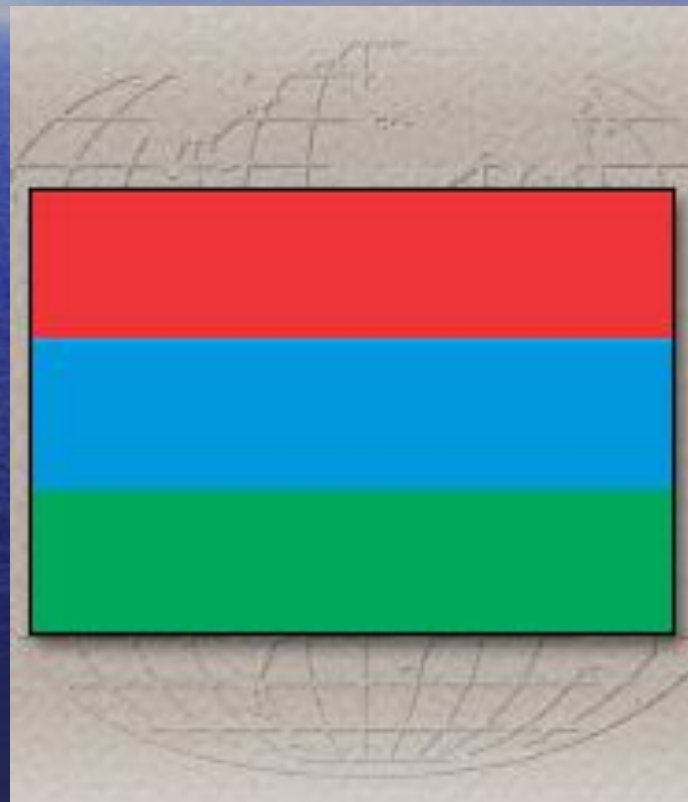
Флаг Республики Карелии