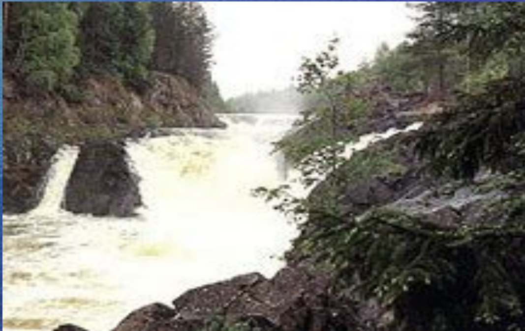
Водопад Кивач. Во время половодья.

В заповеднике есть музей природы и дендрологический парк.