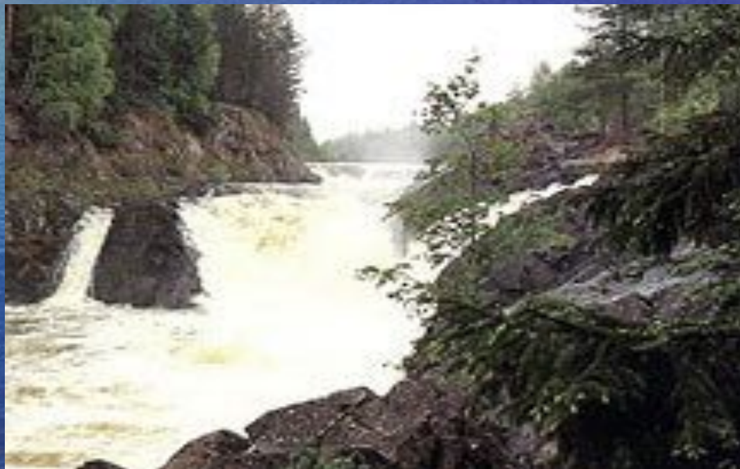
Водопад Кивач. Во время половодья.

В заповеднике есть музей природы и дендрологический парк.