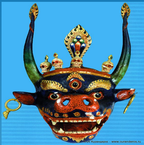
Монголия 19 в