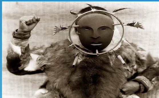
Северная Америка 19в