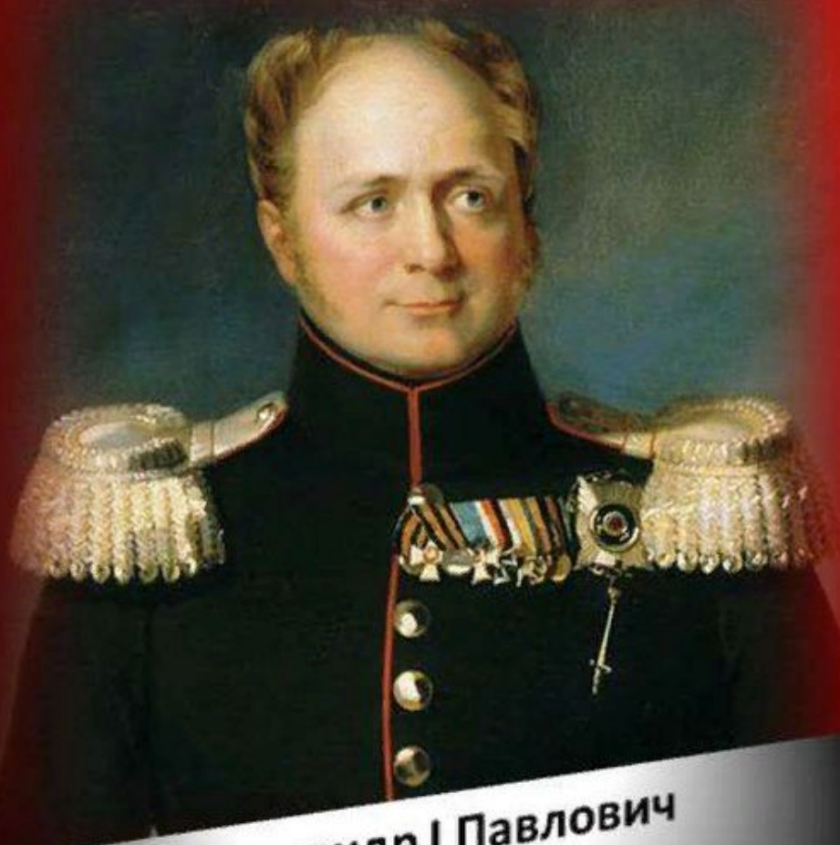
Александр I Павлович Благословенный [1777–1825]