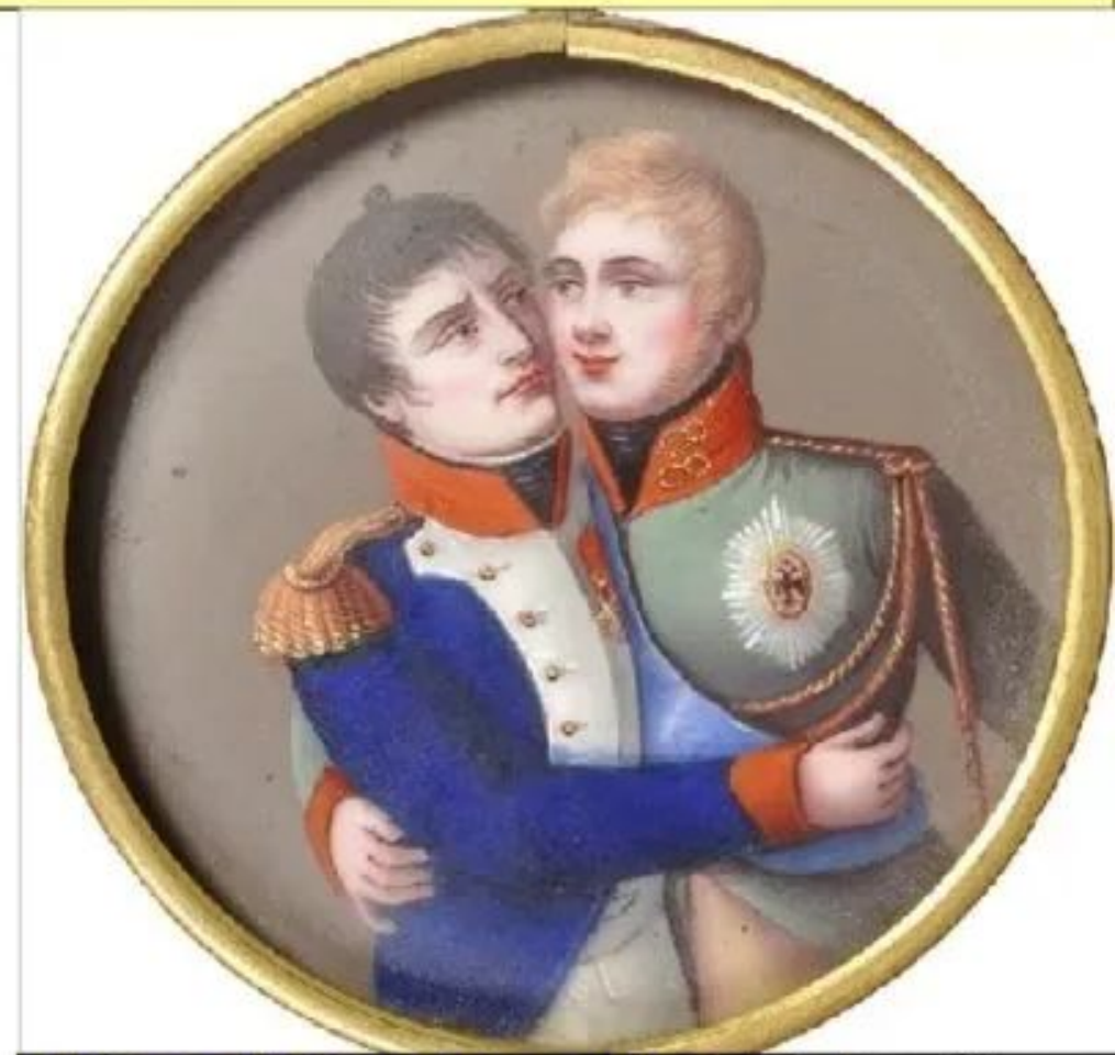
Наполеон и Александр. Французский медальон. Около 1810 года