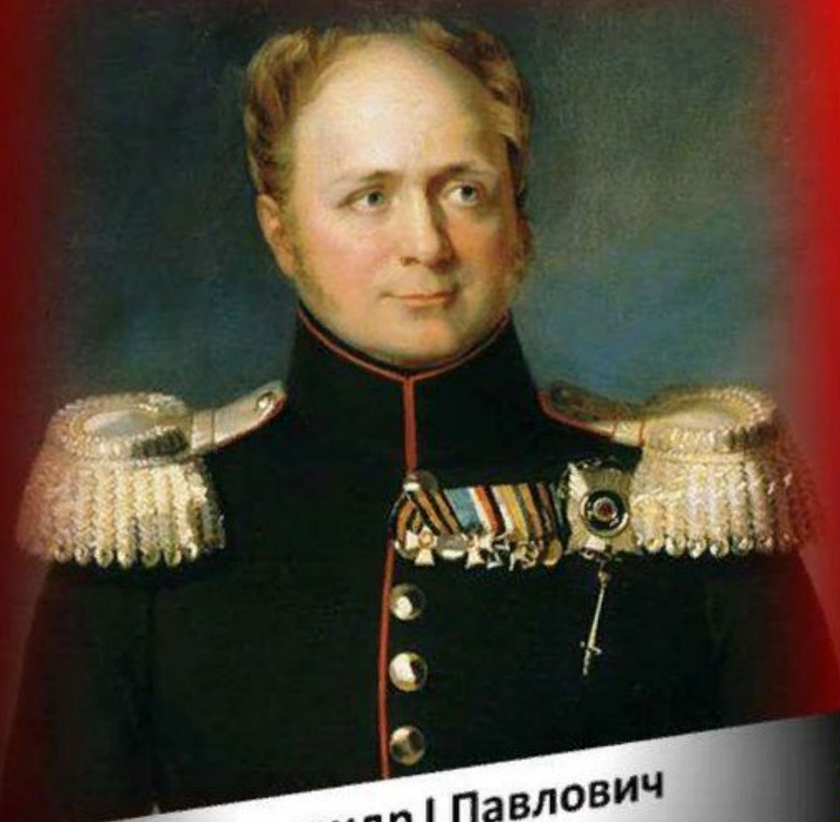
Александр I Павлович Благословенный [1777–1825]