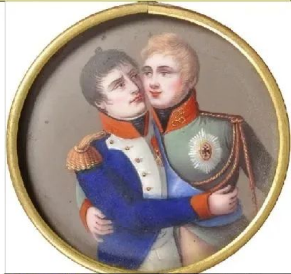
Наполеон и Александр. Французский медальон. Около 1810 года