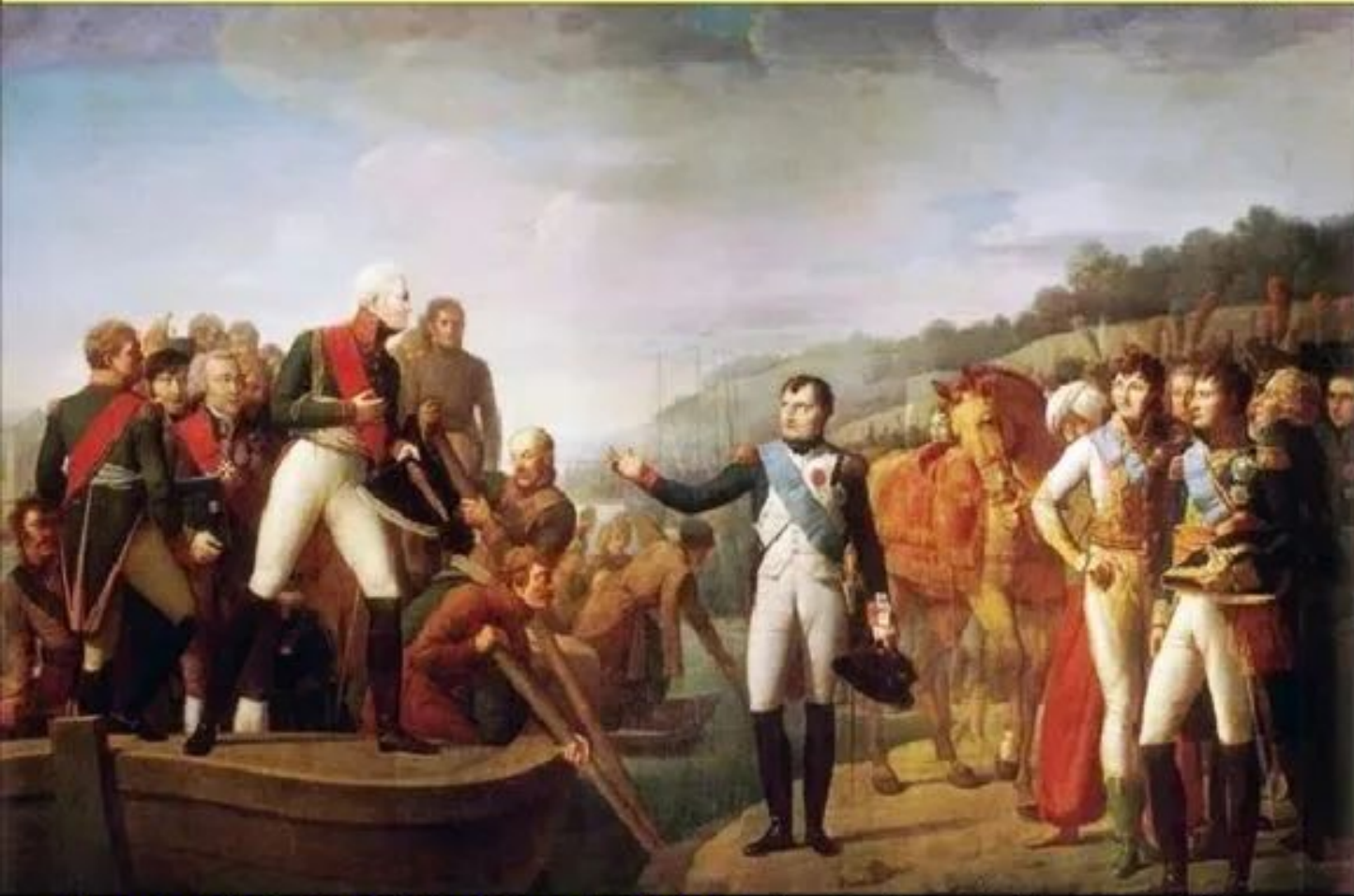
Прощание Наполеона с Александром I в Тильзите. Картина Джоакино Серанжели. 1810 год

«Союз с Наполеоном — лишь изменение способов борьбы против него. Он нужен России для того, чтобы иметь возможность некоторое время дышать свободно и увеличивать в течение этого столь драгоценного времени наши средства и силы... Для этого мы должны работать в глубочайшей тайне и не кричать о наших вооружениях и приготовлениях публично... Самое важное — укрепить связи с бывшими союзниками, прежде всего с Австрией... пусть в империи Наполеона растут внутренние трудности; Россия тем временем будет вооружаться».