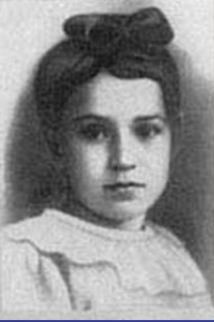
Дневник ленинградской школьницы Тани Савичевой