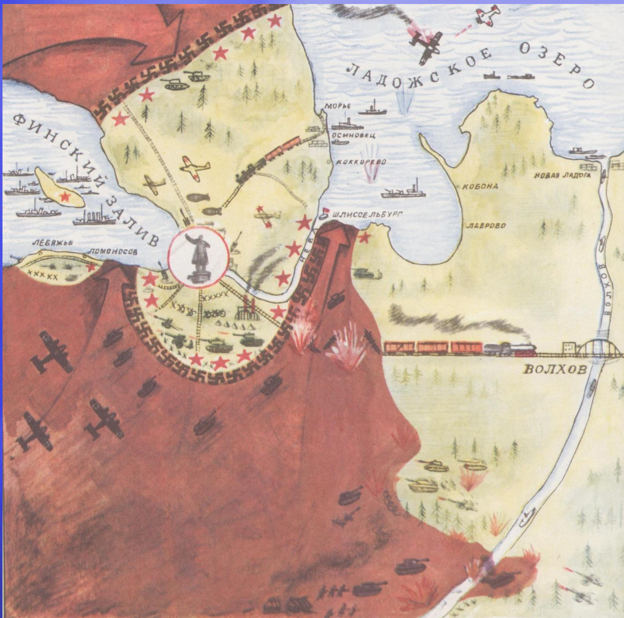
Карта блокадного Ленинграда