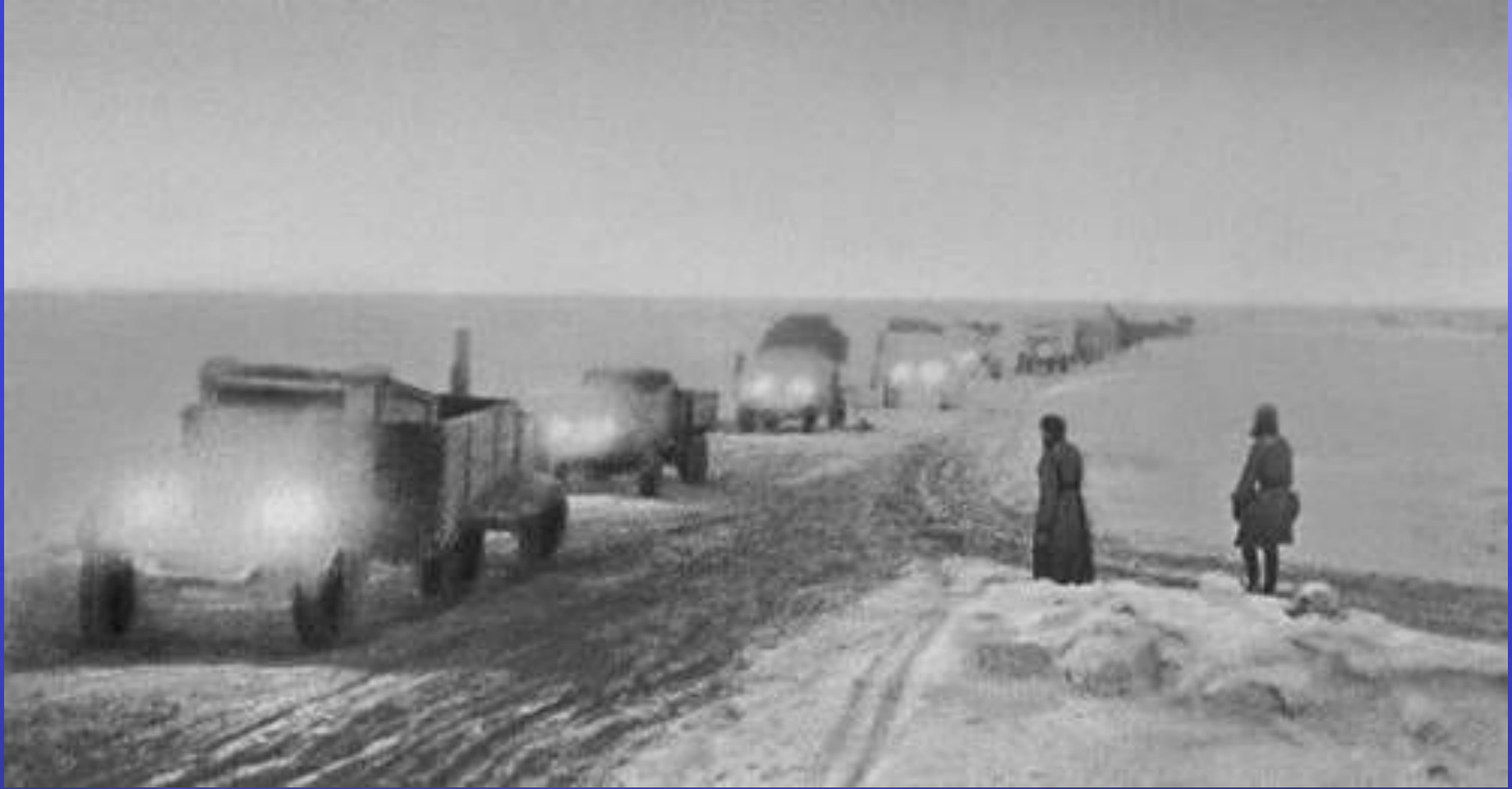
«Дорога жизни» через Ладожское озеро. 1942 г.