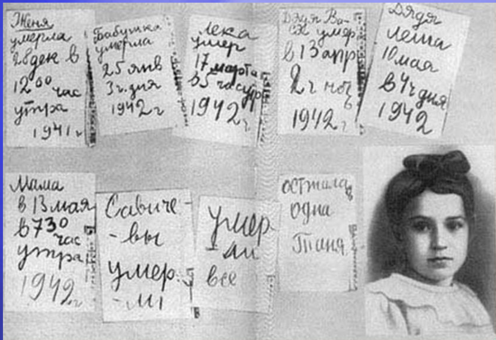
Дневник ленинградской школьницы Тани Савичевой