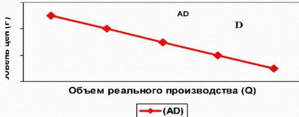
Кривая совокупного спроса

Совокупный спрос представляет собой модель, показывающую реальный объем национального производства (ВНП), который домашние хозяйства, фирмы, государство и иностранцы готовы купить при любом возможном уровне цен. При прочих равных условиях, чем ниже уровень цен, тем больше совокупный спрос, и наоборот.