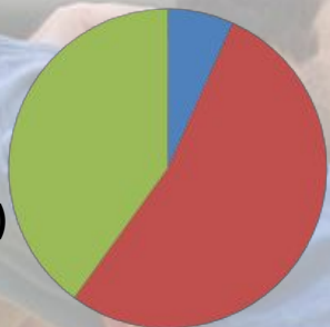
• Диаграмма (рис.1)