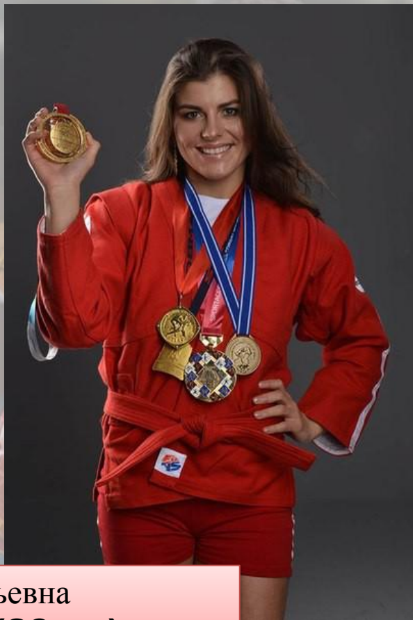
Марина Юрьевна Мохнаткина ( 30 лет)

Российская самбистка, 7 -кратная чемпионка России, двукратная чемпионка Европы, 6 -кратная чемпионка мира, Заслуженный мастер спорта России. На летней Универсиаде в Казани возглавила женскую сборную и завоевала золотую медаль в весовой категории до 68