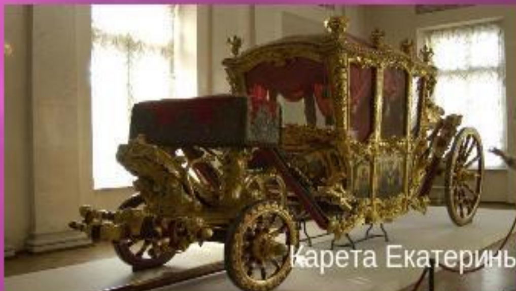
Карета Екатерины II