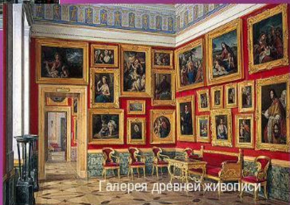
Галерея древней живописи