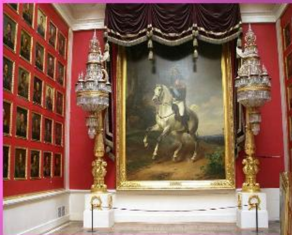
Зал триумфа над Францией.