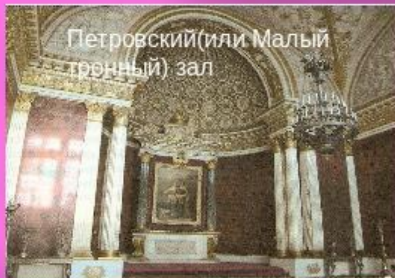
Петровский (или Малый тронный) зал