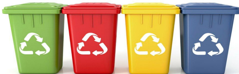
Как обращаются с отходами в разных странах мира