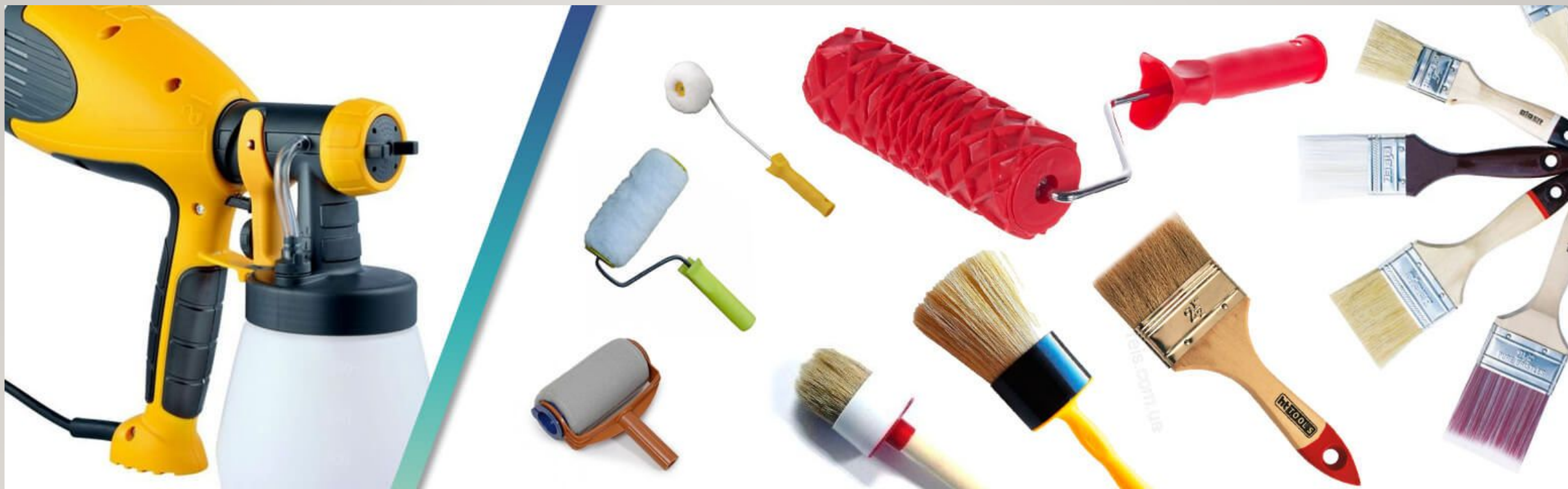
Кисточки, валики, пульверизатор