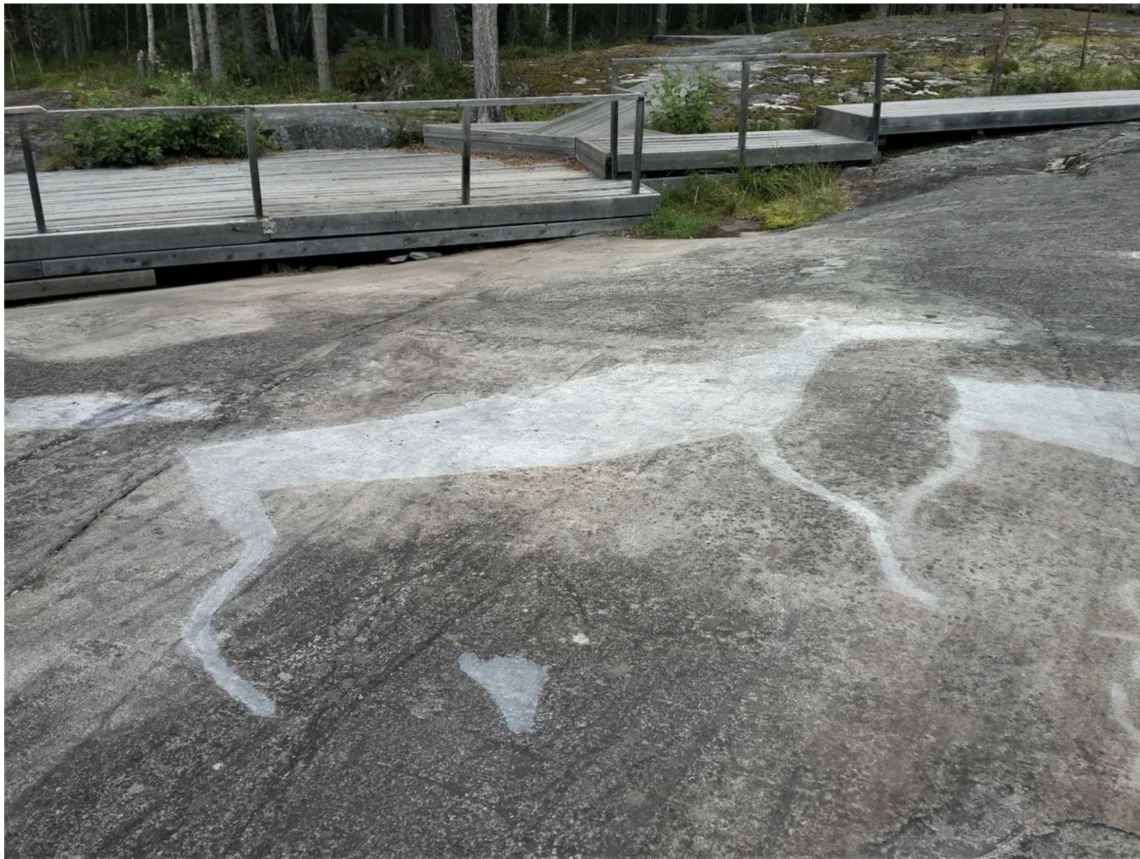
Фото 5. Петроглиф