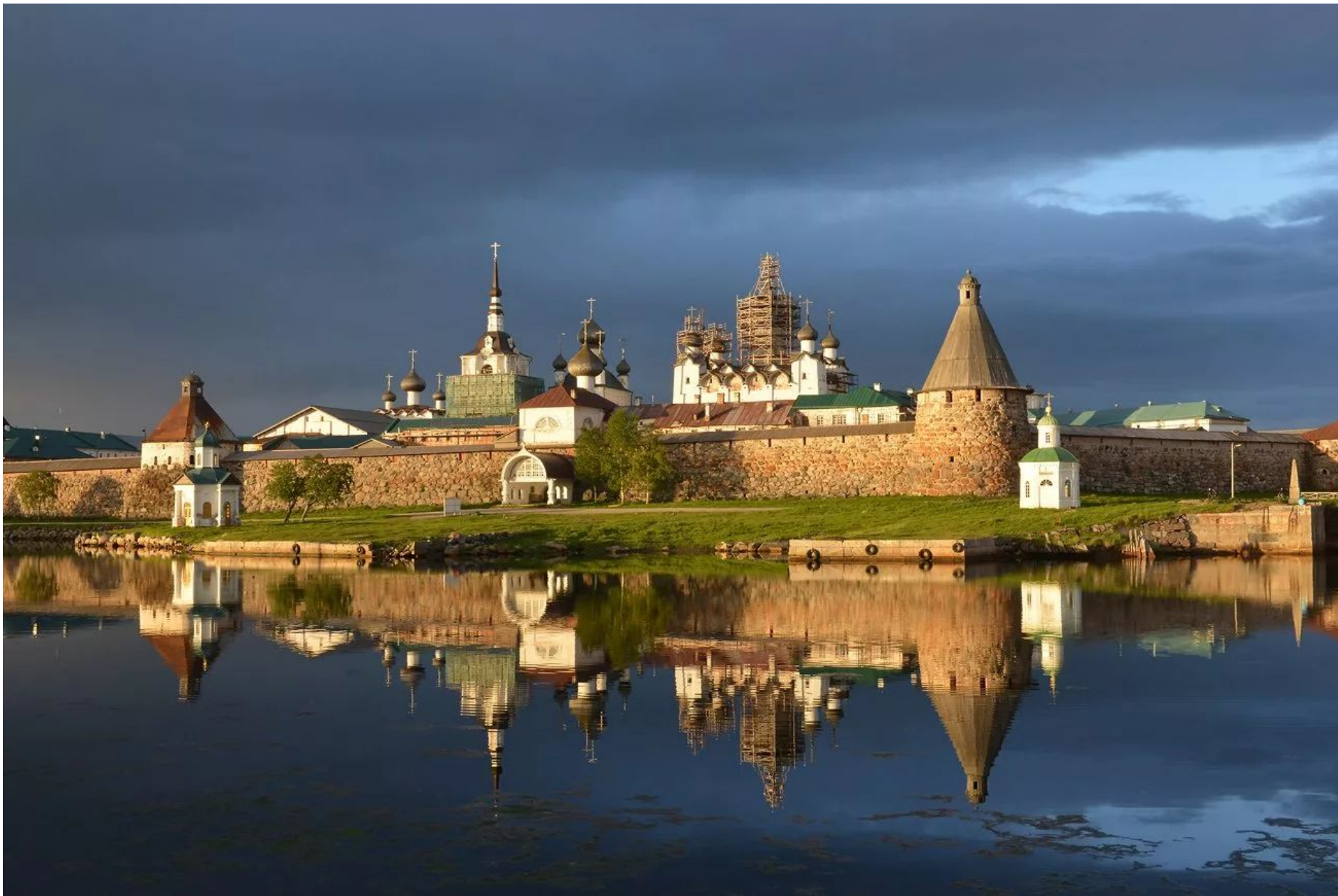
Фото 6. Соловецкий монастырь