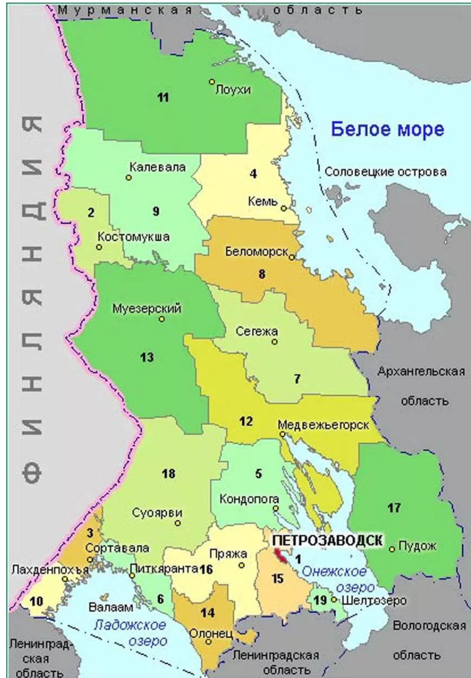
Картограмма 1. Р-ка Карелия и сопряженные территории