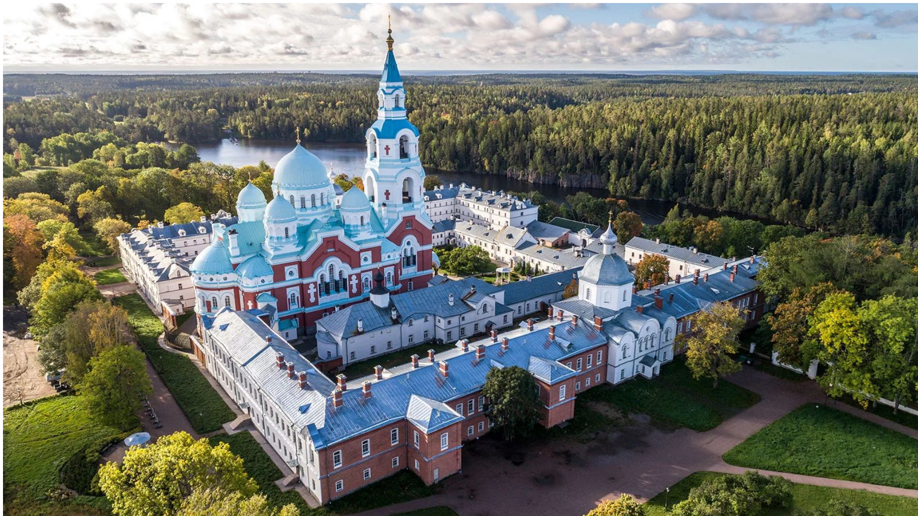
Фото 4. о. Валаам