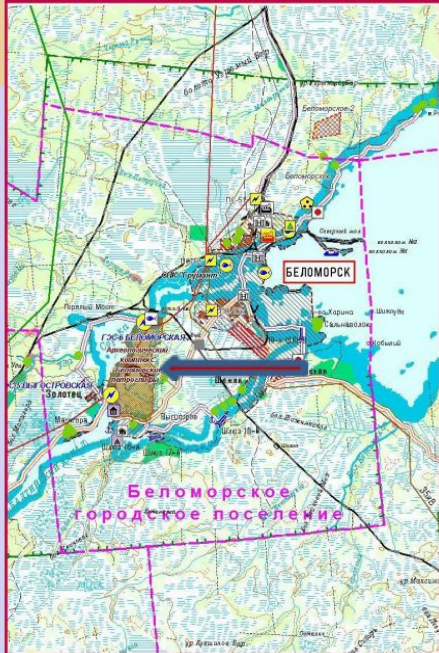
Картосхема 2. Автотуристский кластер