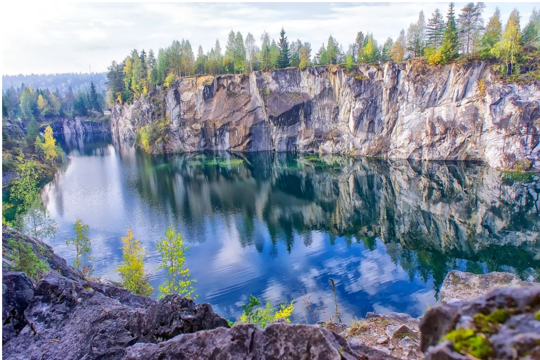
Фото 3. Горный парк «Рускеала»