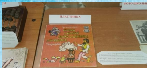
Грампластинка и граммофон на уроках музыки