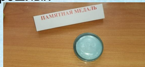
Медаль 100летия школы