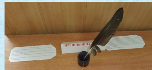
Чернильница и перо