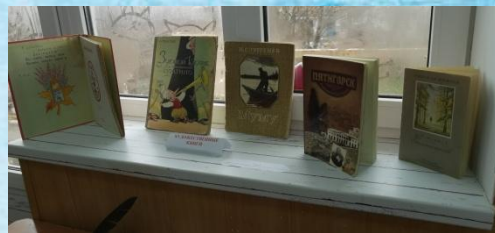
Художественные книги прошлого века.