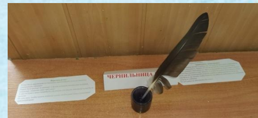
Чернильница и перо