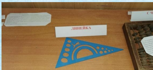
Линейка с шаблонами