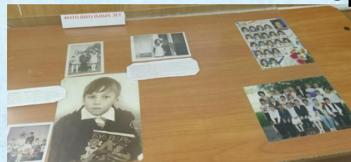
Фото прошлых лет