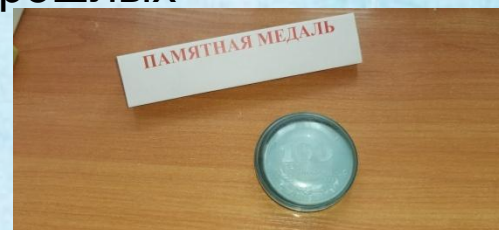
Медаль 100летия школы