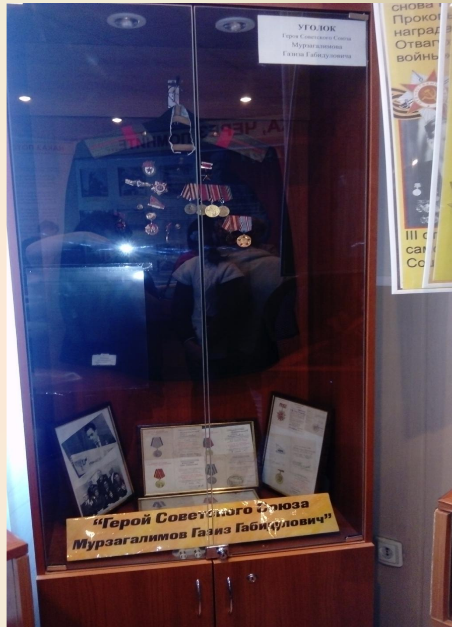
В 2016 году руководитель и актив музея, родственники, сельский библиотекарь посетили музей , где свято хранят память о нашем