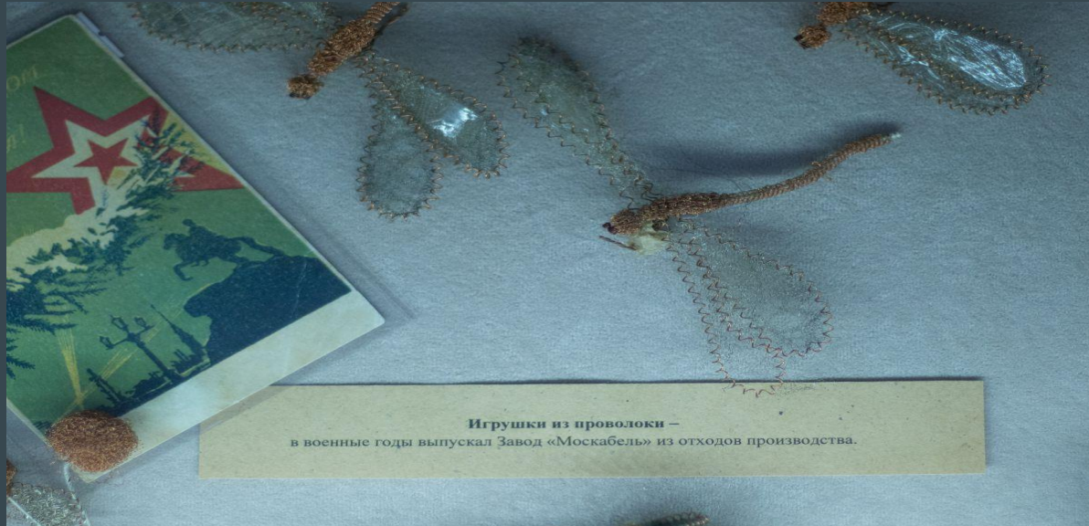
Игрушки из проволоки – в военные годы выпускал Завод «Москабель» из отходов производства.

Новогодние игрушки этого периода производили в годы Великой Отечественной Войны на заводе "Москабель". Завод не специализировался на изготовлении игрушек, но подарить праздник детям было очень важно в тяжелое военное время, поэтому украшения на елку делали из отходов производства - проволоки.