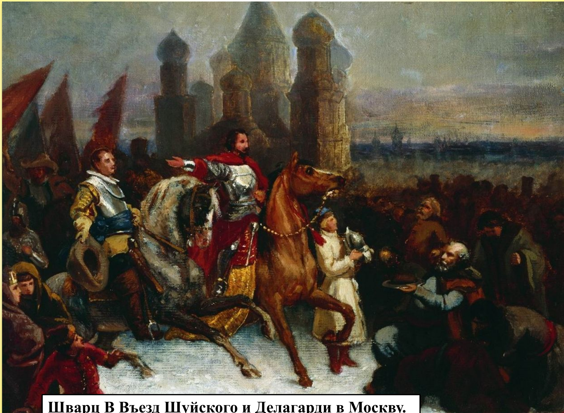
Шварц В Въезд Шуйского и Делагарди в Москву.