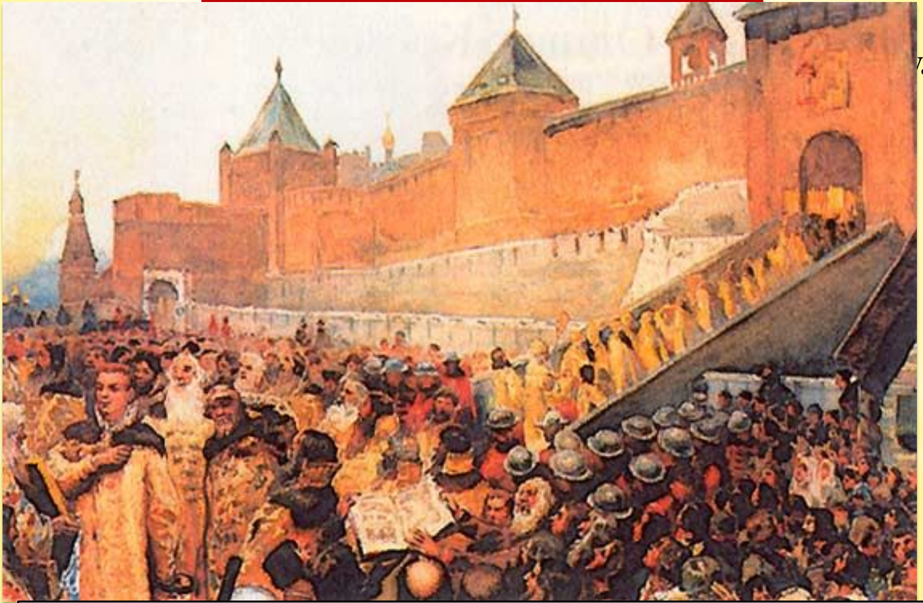
Лебедев К. Вступление Димитрия I в Москву.