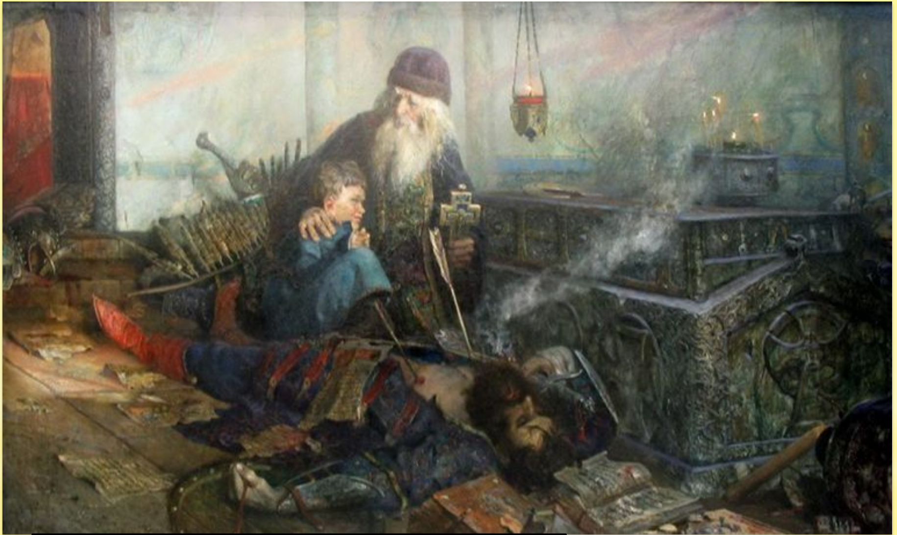
Рыженко П. Смутное время.