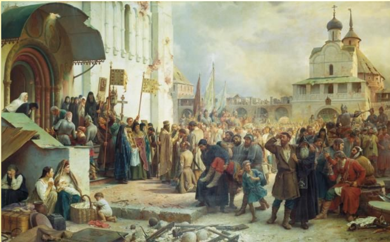
Верещагин В. Осада Троице-Сергиевой Лавры

Центрами сопротивления стали монастыри. 16-месячную осаду выдержал Троице-Сергиев монастырь.