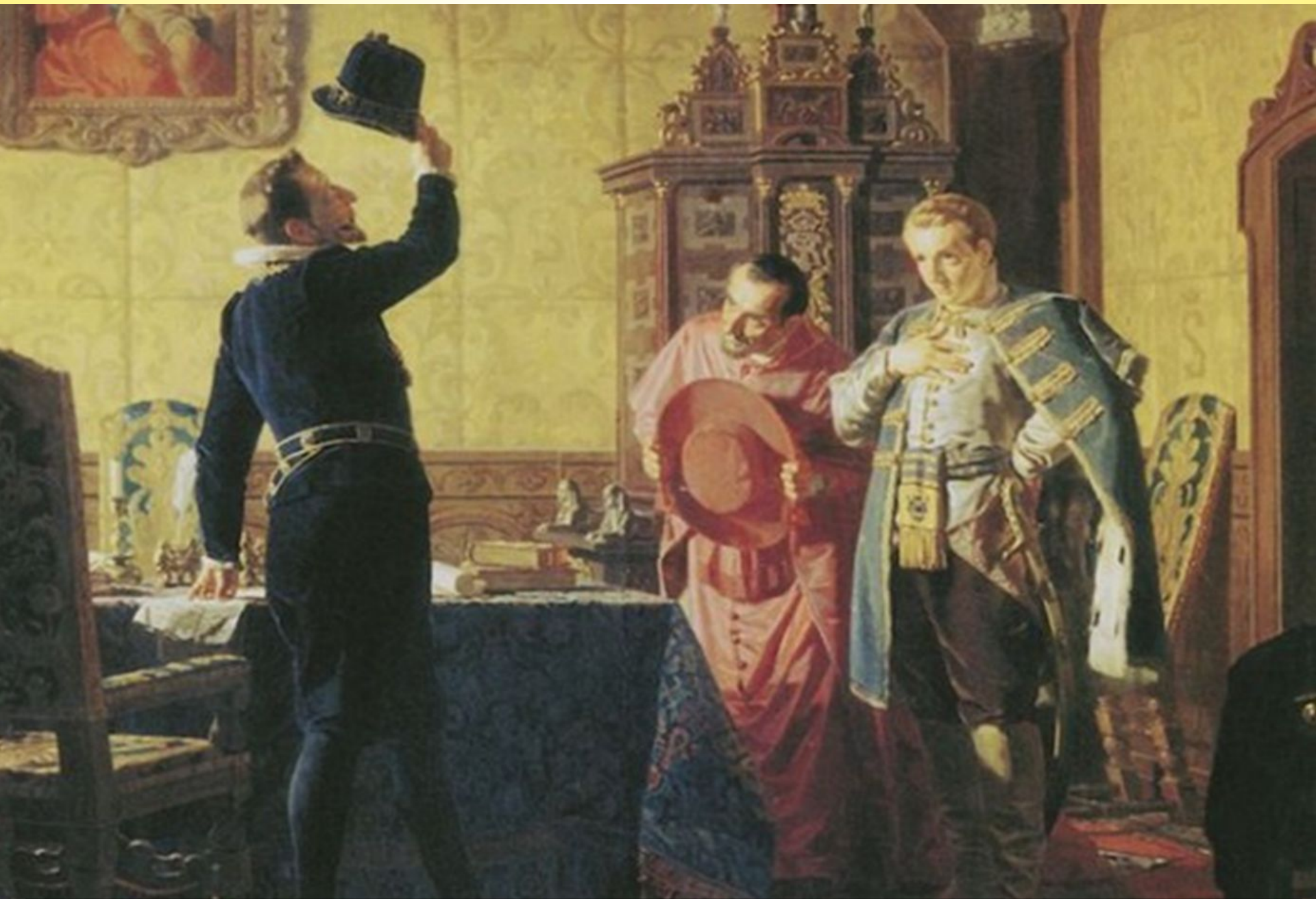
Неврев Н. Присяга Лжедмитрия I польскому королю Сигизмунду III на введение в России католицизма.