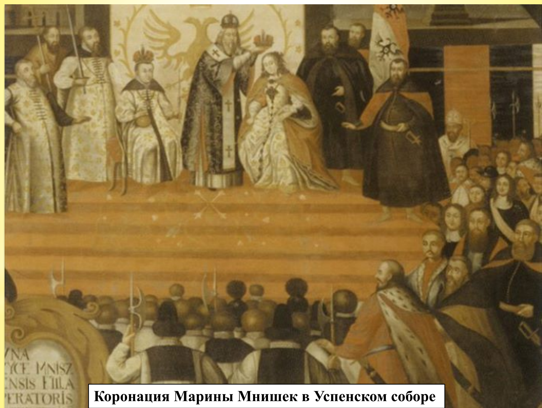
Коронация Марины Мнишек в Успенском соборе