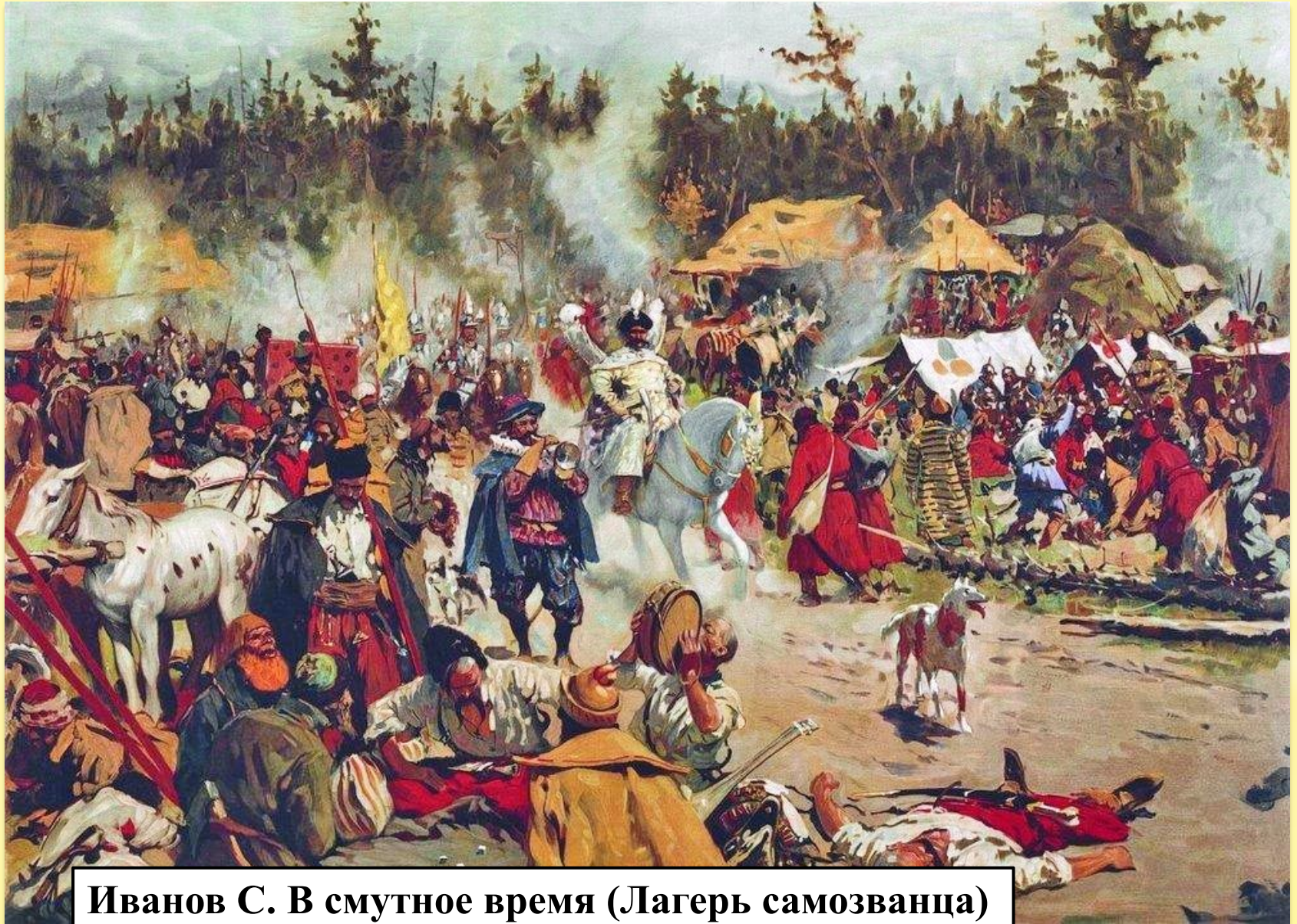
Иванов С. В смутное время (Лагерь самозванца)