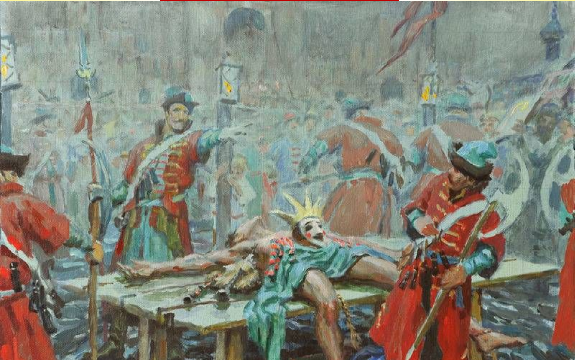
Кириллов С. Эскиз к картине «Смутное время. Лжедмитрий»