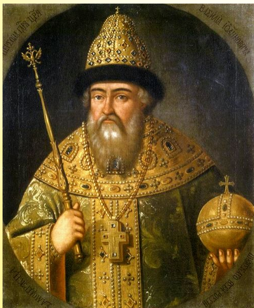
Василий IV Иоаннович Шуйский

Патриархом Русской православной церкви был избран сторонник Василия Шуйского – казанский митрополит Гермоген.