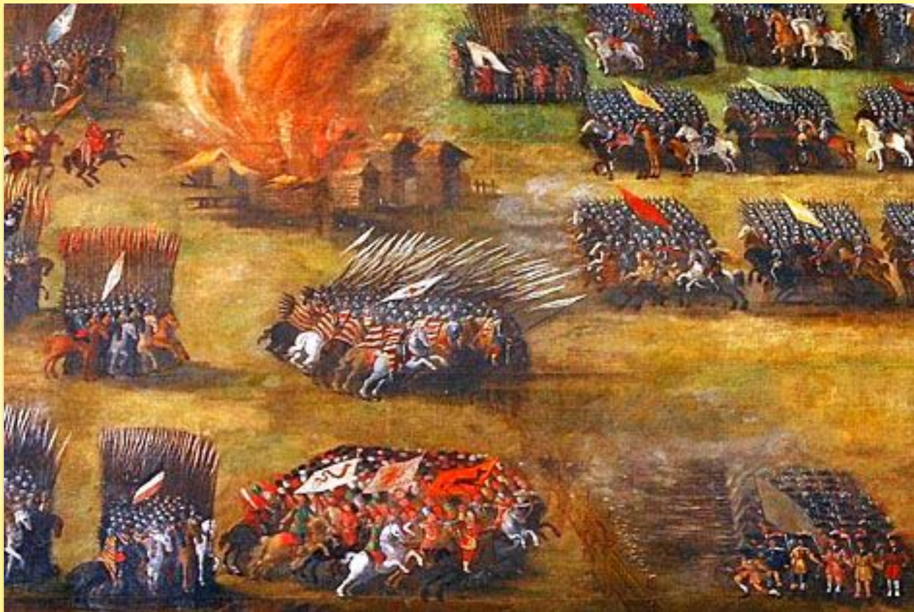
Богушович С Клушинская битва