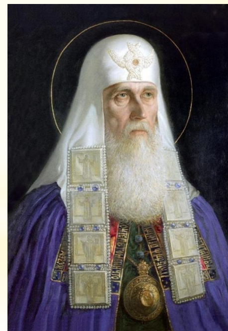
Шилов В. Патриарх Гермоген