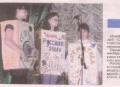
Театральный урок в саховоде

Гребенка — это инструмент, который используется для расчесывания волос. Она имеет ряд зубцов, которые помогают равномерно распределить волосы. Гребенки бывают разных размеров и материалов. Они используются как для повседневного ухода за волосами, так и для профессиональных целей. Если вы не знаете, как использовать гребенку, попробуйте посмотреть обучающие видео или обратиться к специалисту по уходу за волосами.