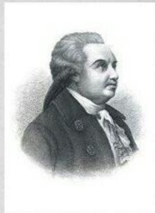
Денис Иванович Фонвизин (1745 — 1792) — русский литератор екатерининской эпохи, создатель русской бытовой комедии