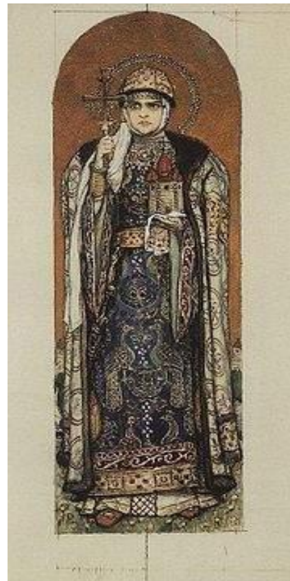
Княгиня Ольга. В. М. Васнецов

Только самые яркие личности остаются в памяти народной, только о них повестьуют летописи. Но и среди летописных рассказов выделяется история жизни и деяний княгини Ольги.