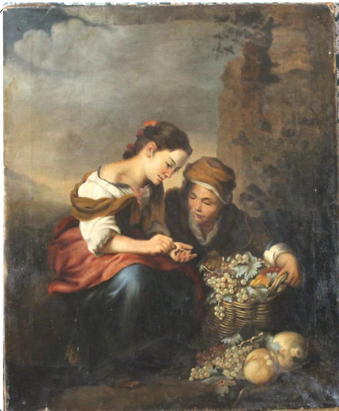
Прекрасна картина «Продавщица фруктов» (1670-1675).