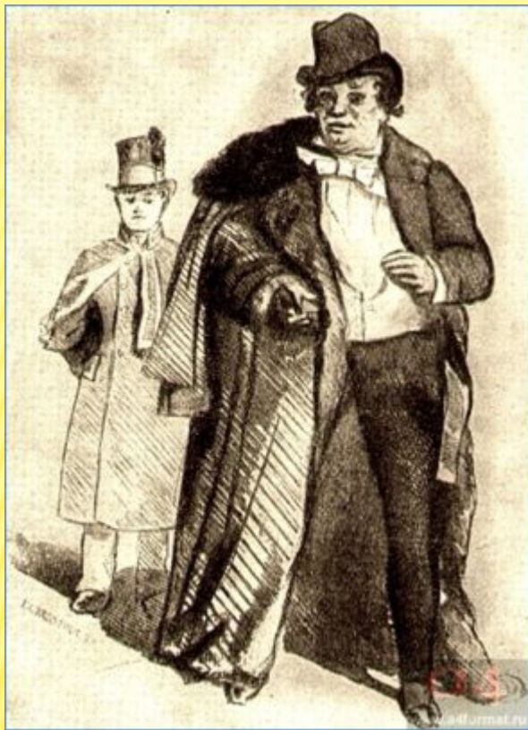
«Горе от ума». Репетиллов. Художник П. Соколов. 1866