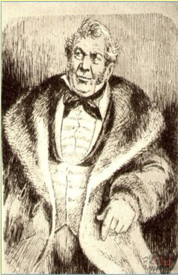
Фамусов. Художник Н. Кузьмин. 1949