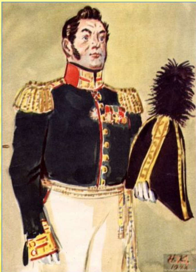
Скалозуб. Художник Н. Кузьмин. 1948

Сергей Сергеевич Скалозуб С точки зрения Фамусова, полковник Скалозуб – самый желанный жених для Софьи. Очень ограниченный человек: если и думает о чем-то, то только о своей карьере. Его интересуют лишь военные упражнения и танцы. Враг всякого знания и просвещения. Он надежный защитник старины, как и все представители фамусовского общества.