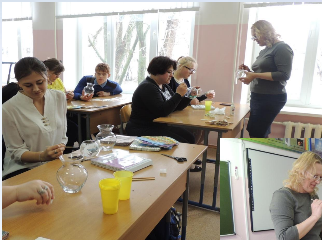
Мастер –класс «Декупаж вазы»