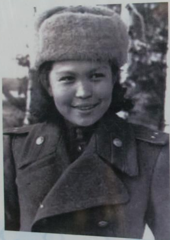
Хиуаз Қайырқызы Доспанова (1922—2008) Ұлы Отан соғысы жылдарында Марина Раскова басқарған 46-гвардиялық түнгі бомбалаушы- ұшқыштар полкінде штурман қызметін атқарған қазақтың ұшқыш жауынгері