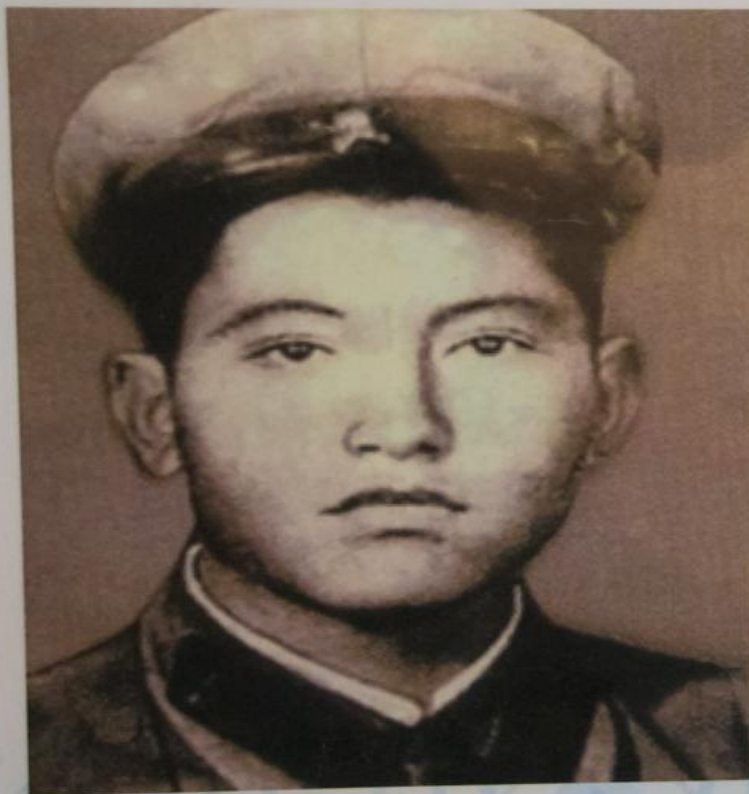
Бақтыораз Бейсекбаев (1920—1941). Жиырма бір жасында Отан үшін жанын қиған жас қаһарман