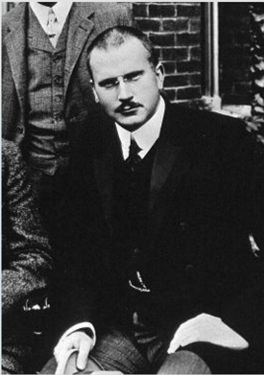
Карл Густав Юнг