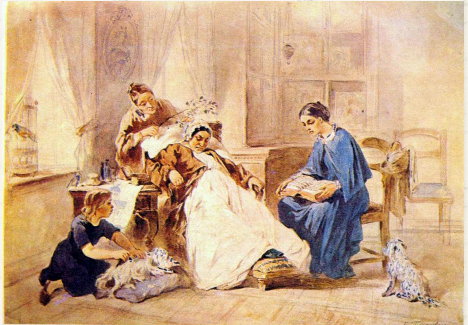
Благодетельница. С акварели К. Трутовского