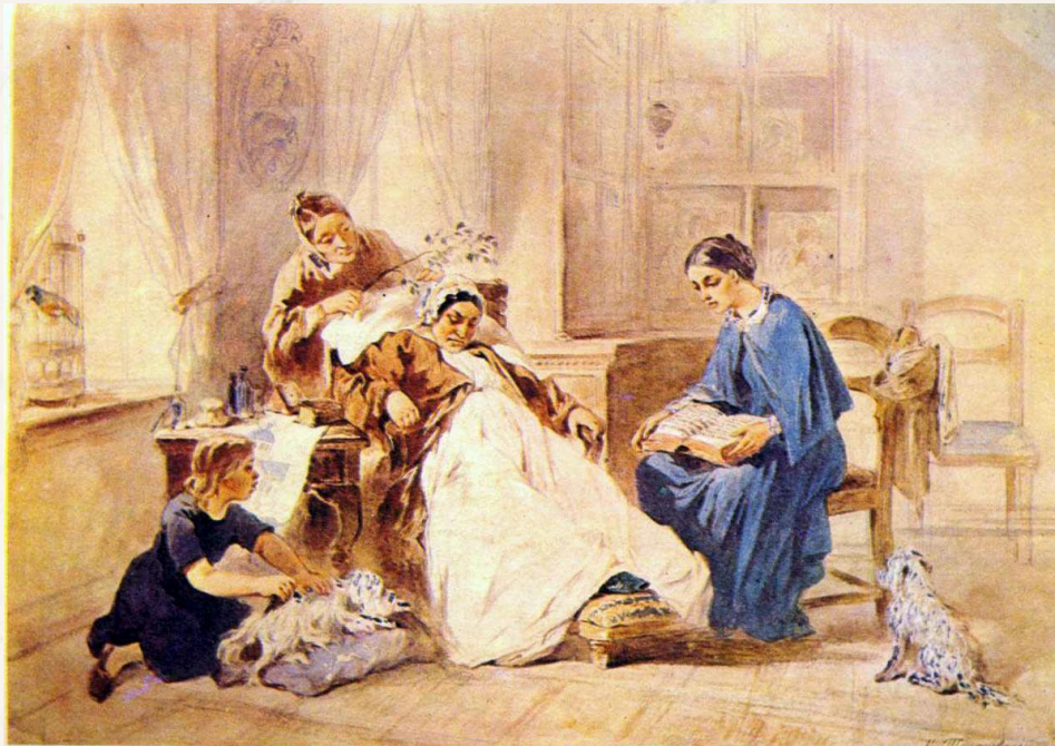
Благодетельница. С акварели К. Трутовского