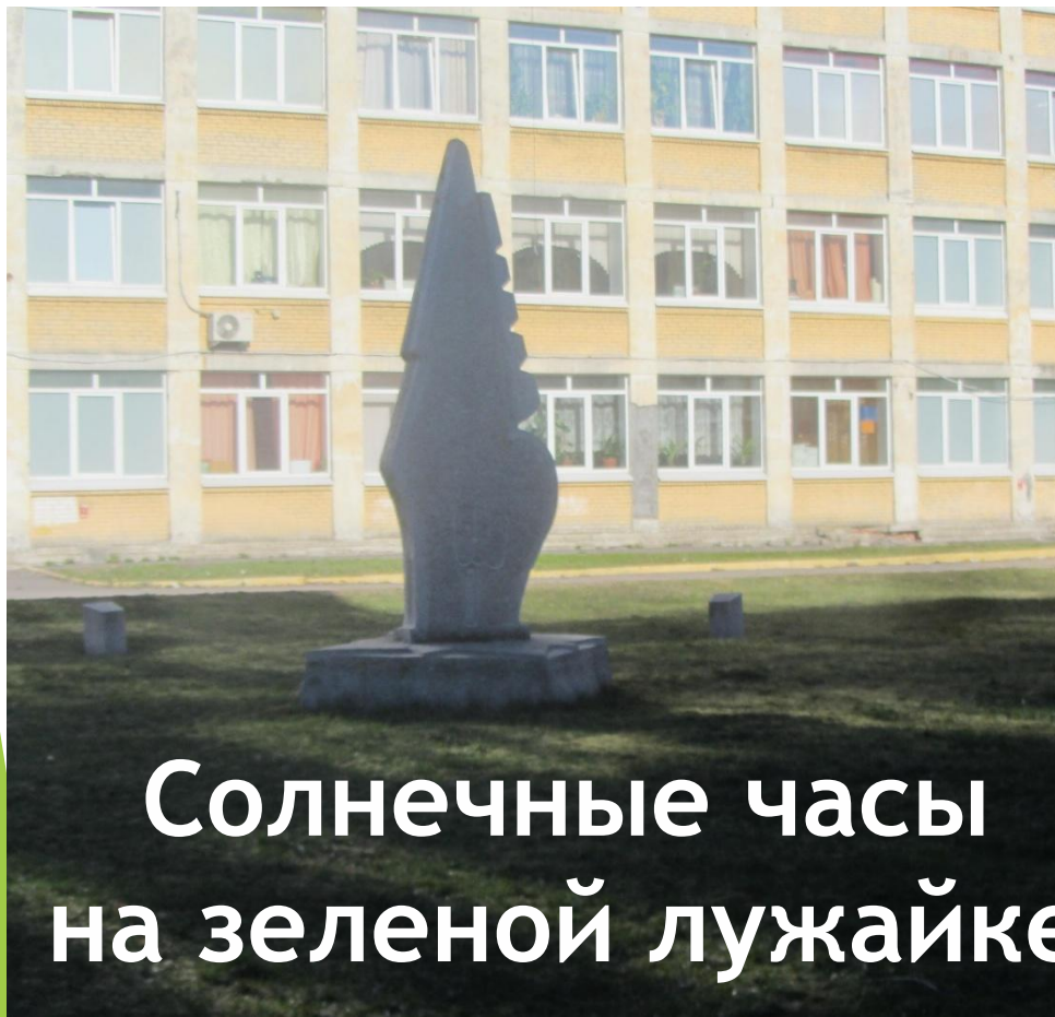
Солнечные часы на зеленой лужайке