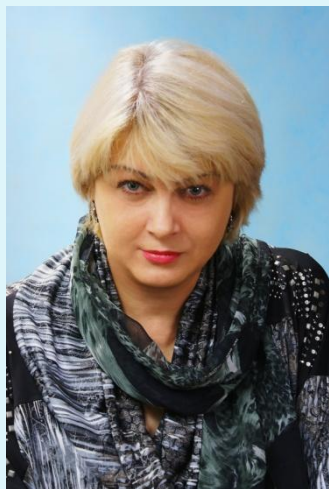
Автор проекта, филолог Кузенко И.В.