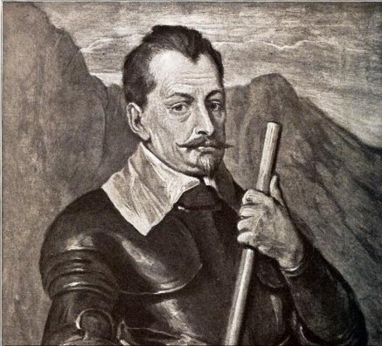
Альбрехт фон Валленштейн