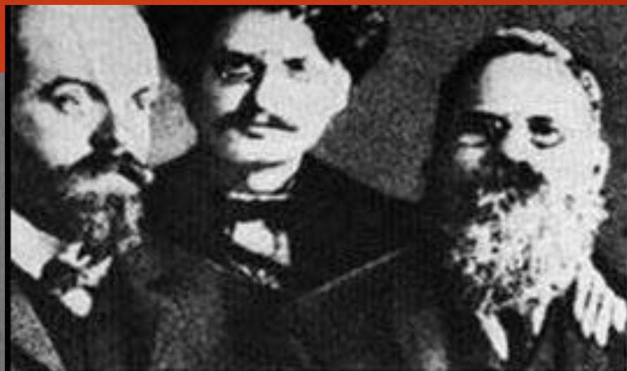
Парвус, Троцкий и Дейч