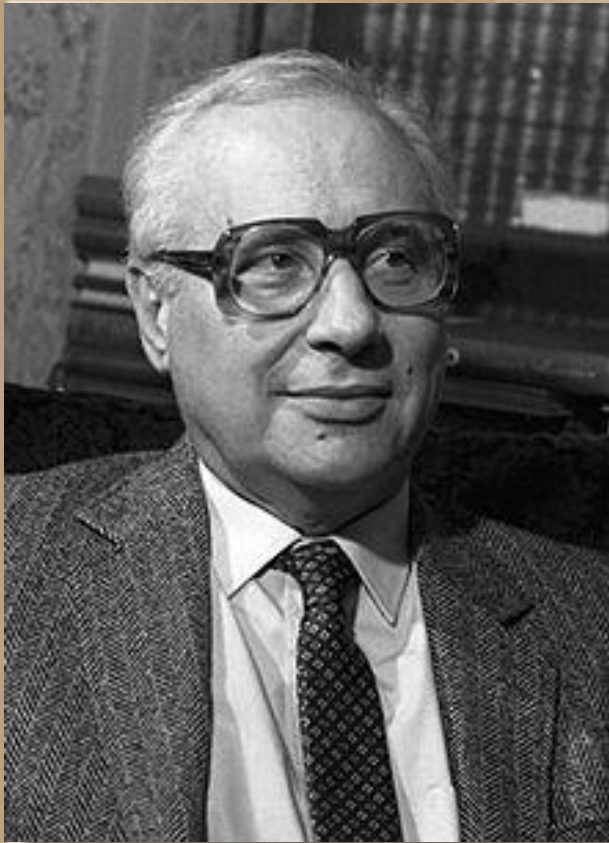
Владимир Карпович Железников