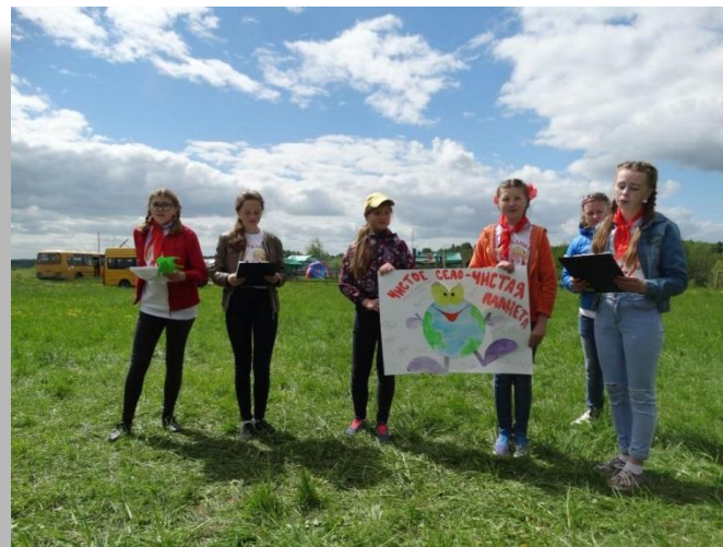
Защита проекта «Чистое село – чистая планета»