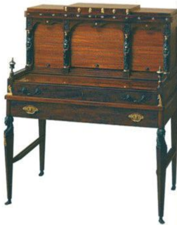
Туалетный столик, столик для рукоделия, украшенный вышивкой (по проекту Воронихина), дамское бюро