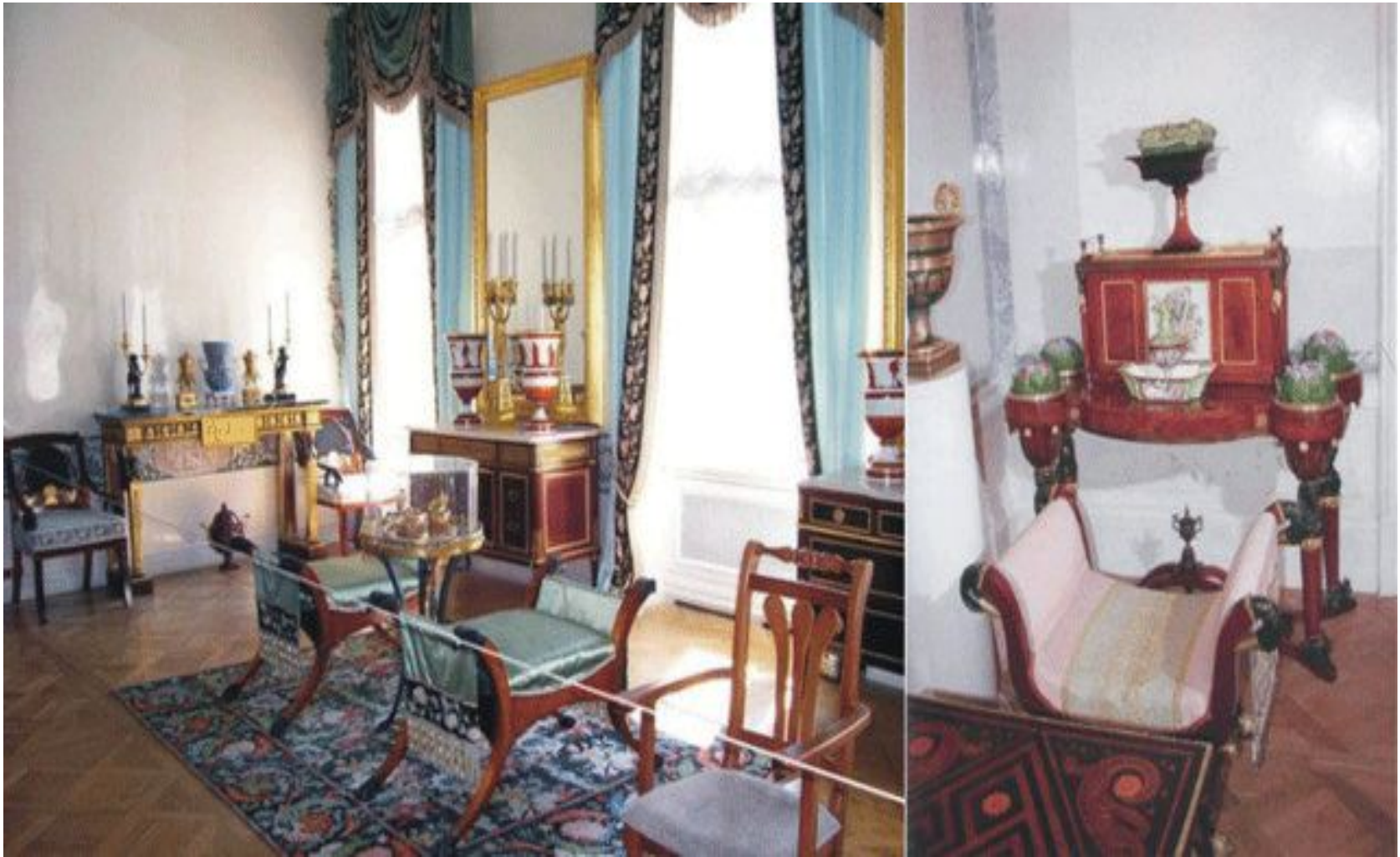
Павловский дворец, жилые покои императрицы Марии Федоровны, Воронихин