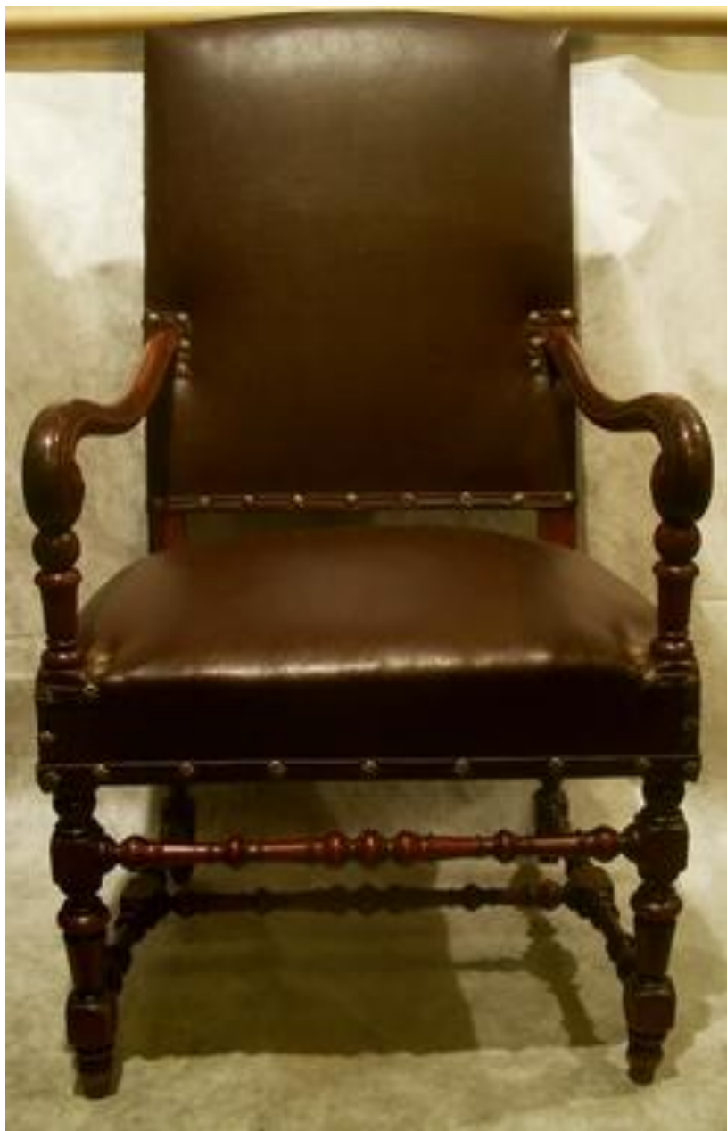
Кресло. сер. 19в.