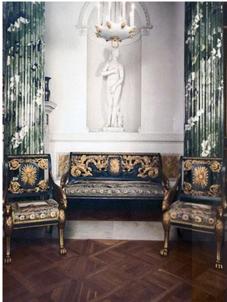
Диван и кресла из Гостиного гарнитура Греческого зала Павловского дворца

Диван и кресла из Греческого зала, обитые гобеленами мануфактуры Бове, принадлежат к ранним мебельным идеям архитектора. Из гарнитура в жилых комнатах Павловского дворца происходит диван – «кушет» на опорах в виде лап с львиными головами – излюбленный прием трактовки ножек мебели для сидения в виде звериных и птичьих конечностей.