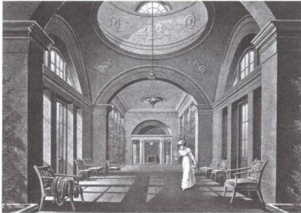
Павильон Вольтер. Акварель неизвестного художника. 1810-е