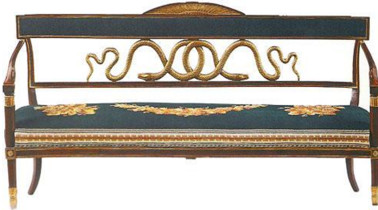
Диван из гостиного гарнитура для графов Строгановых.

Изобретательность Воронихина проявилась и в решении мебели для сидения. Спинки диванов и кресел архитектор решает то в виде грифонов, прячущихся в пышных акантовых зарослях (Греческий зал, 1805), то в виде изысканных по рисунку пальмет (павильон «Вольтер», 1807) или орнамента из змей (гарнитур из дома Шуваловых, 1805), поражающего совершенством и одновременно простотой