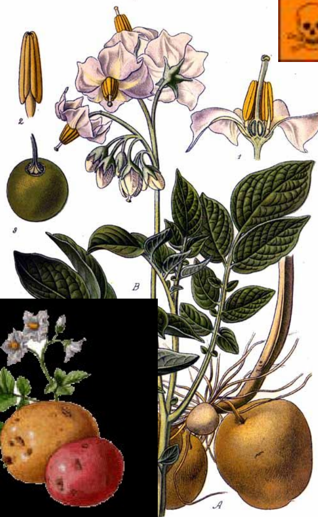
Pl. 234. Morelle tubéreuse (Pomme de terre). Solanum tuberosum L.