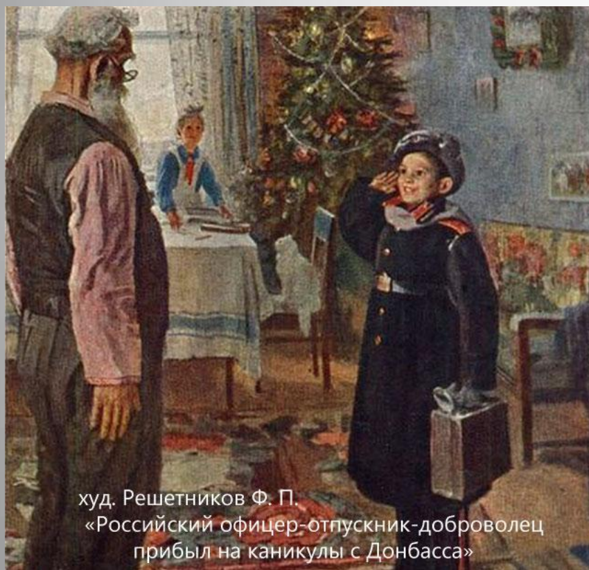
худ. Решетников Ф. П. «Российский офицер-отпускник-доброволец прибыл на каникулы с Донбасса»