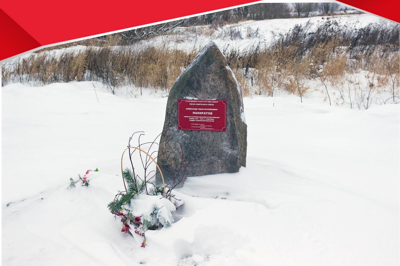
Памятный знак Герою Советского Союза А. К. Панкратову (Абакшино). На малой родине ухаживают Ветераны