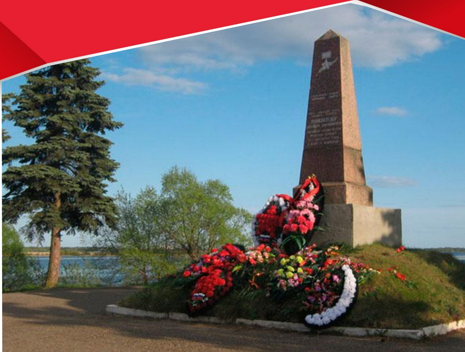
Памятник Александру Панкратову около моста через реку Малый Волховец