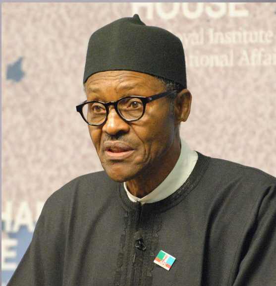
Мохаммаду Бухари англ. Muhammadi Buhari

31 декабря 1983 года генерал-майор Бухари возглавил страну после успешного военного переворота, когда был свергнут президент Шеху Шагари . До переворота, Бухари командовал бронетанковой дивизией в городе Джос [1] . Мохаммаду Бухари считал оправданным захват военными власти в стране, так как по его мнению, гражданское правительство было безнадежно коррумпировано. После прихода к власти военных, за опоздание на работу государственных служащих ждало публичное унижение (они были вынуждены прыгать как лягушка ) [2] .