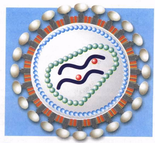
Вирус Иммунодефицита Человека