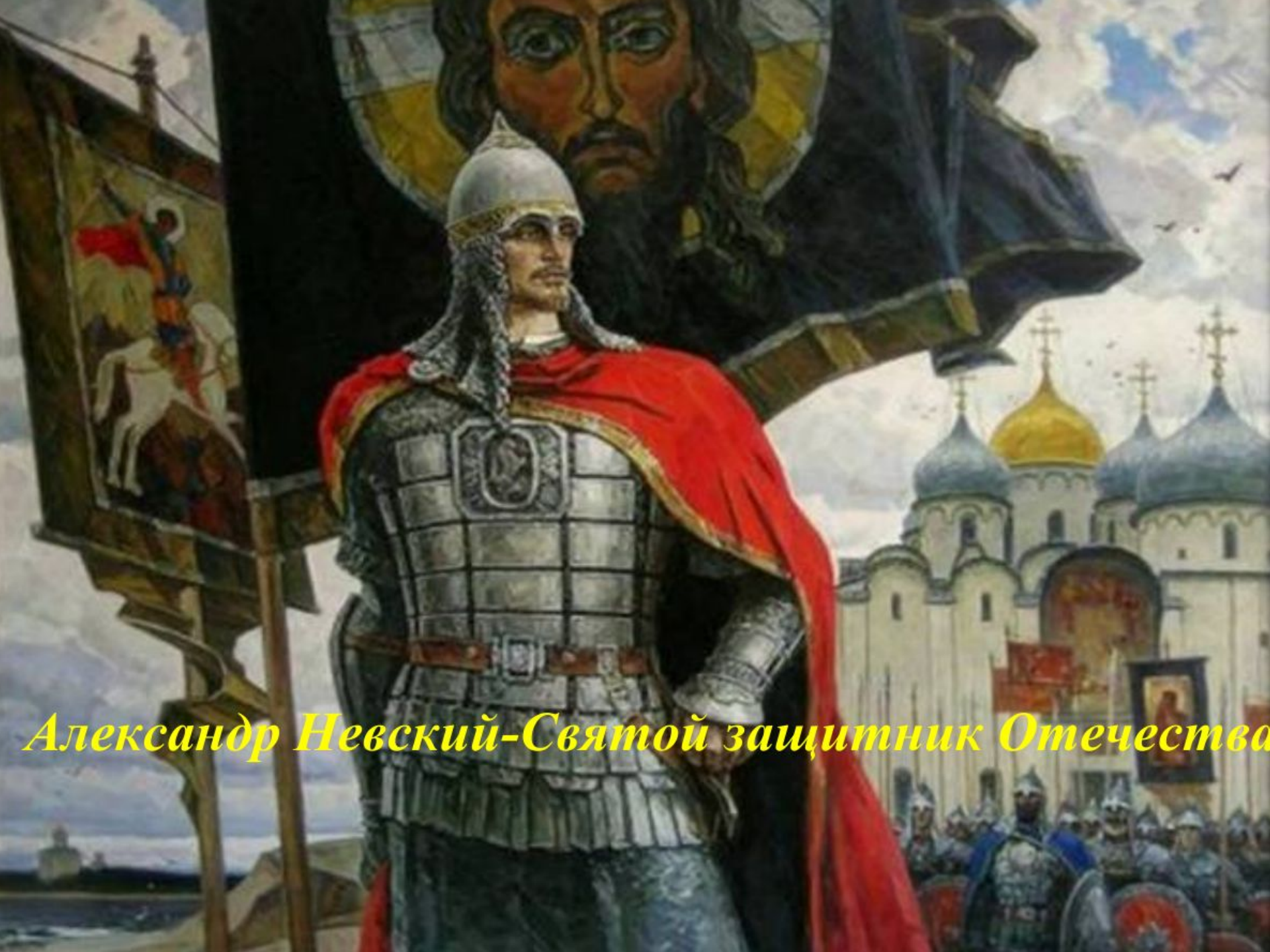
Александр Невский-Святой защитник Отечества