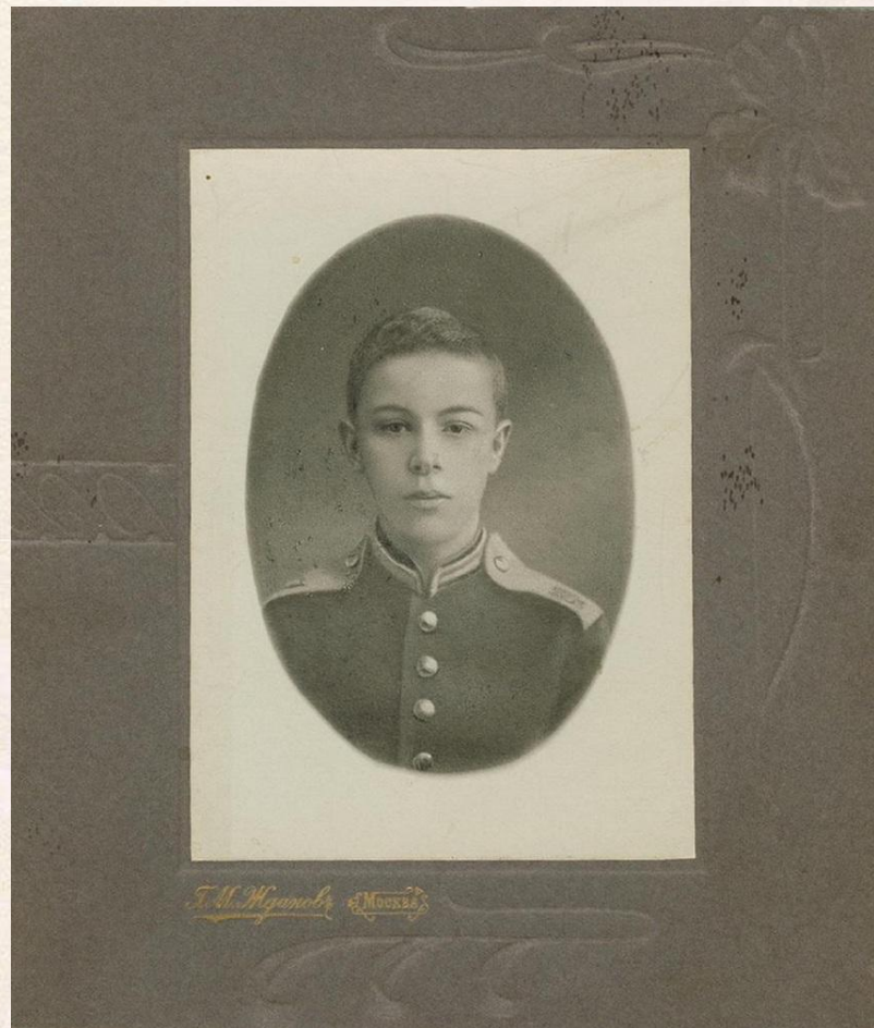
Кадет А. Н. Скрябин, 1886

В мае 1889 года Скрябин окончил свое обучение в кадетском корпусе со средним баллом 9,17 из десяти.