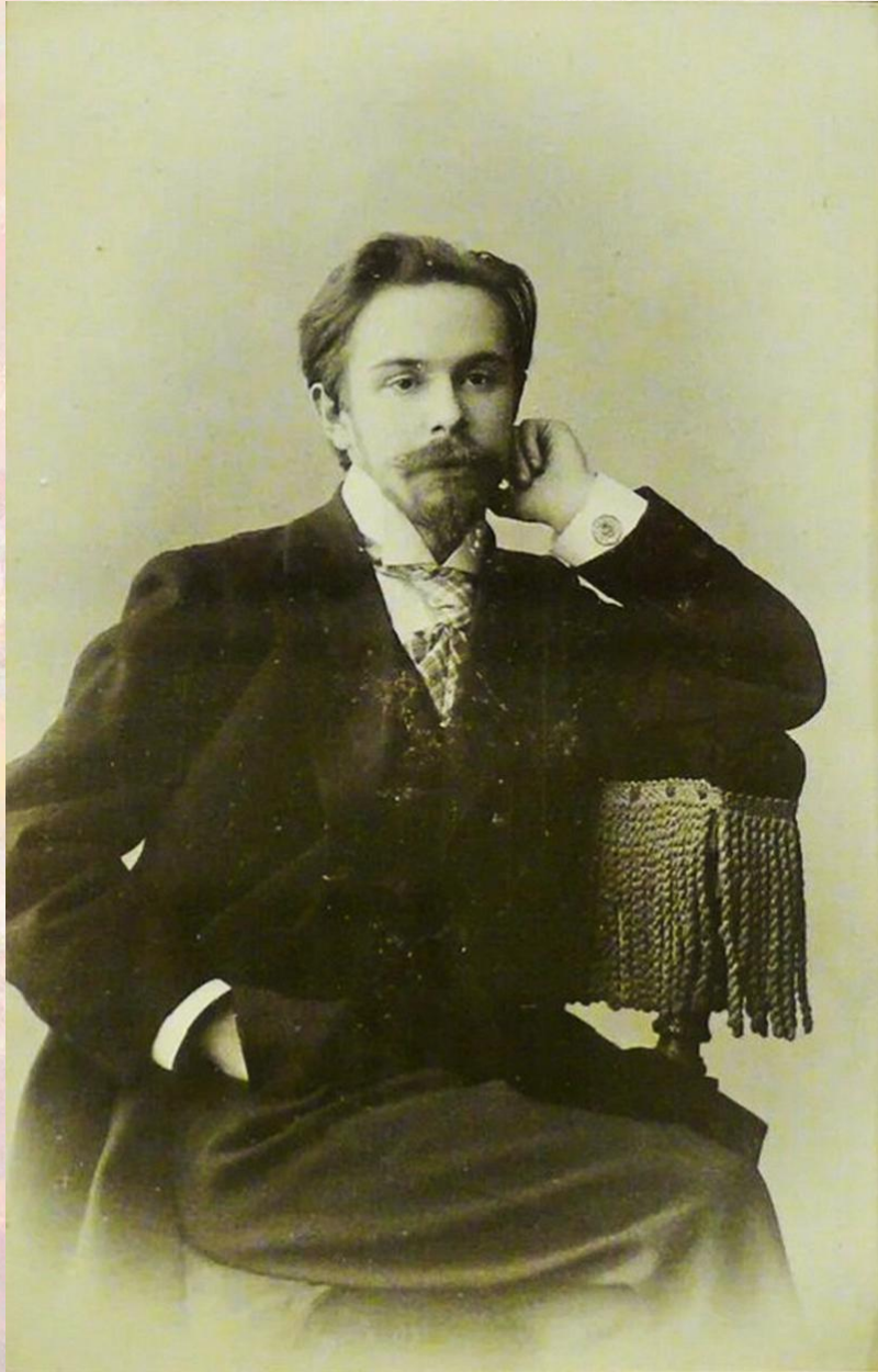
А. Н. Скрябин, 1890-е гг.

В 1905 году умер покровитель Александра Скрябина, Митрофан Беляев, и композитор оказался в сложном материальном положении. Однако это не мешало ему работать: в это время он начал писать «Поэму экстаза». Сам автор говорил, что музыка была навеяна революцией и ее идеалами, поэтому эпиграфом поэмы он выбрал призыв «Вставай, поднимайся, рабочий народ!».