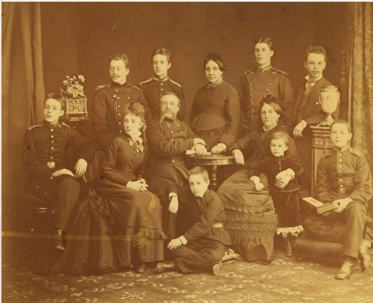
Скрябин Александр Николаевич в возрасте трех лет с родственниками, 1875