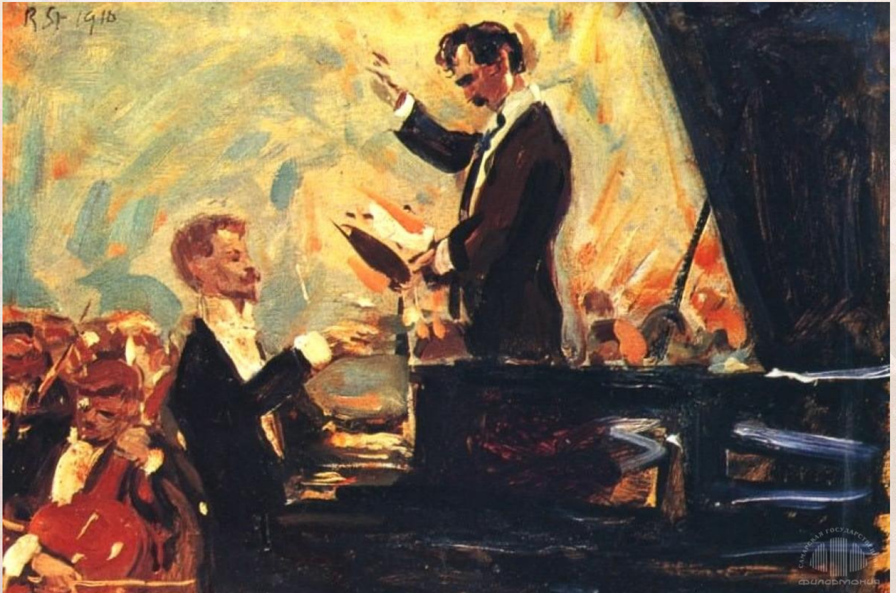
Р.Штерль. Концерт для фортепиано. 1910 г. На картине С.Кусевицкий - дирижер и А.Скрябин