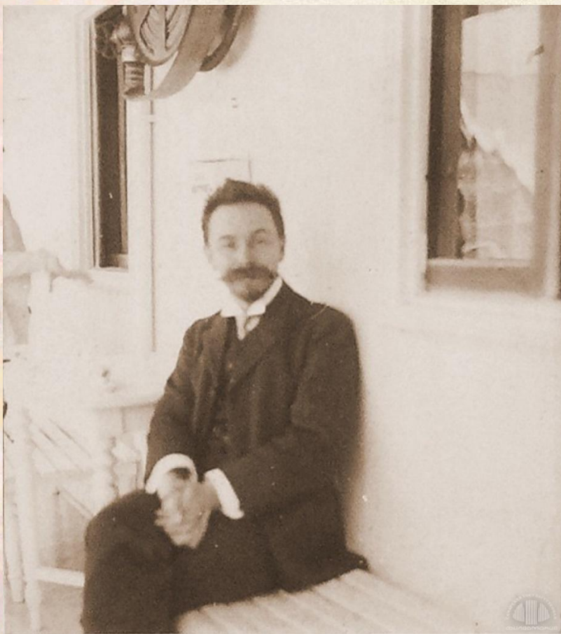
Скрябин на пароходе во время волжских гастролей, весна 1910 г.

В 1909 году Александр Скрябин вернулся в Россию, где к нему пришла настоящая слава. Его произведения играли на лучших площадках Москвы и Санкт-Петербурга, сам композитор отправился в концертное турне по волжским городам с симфоническим оркестром Сергея Кусевицкого.