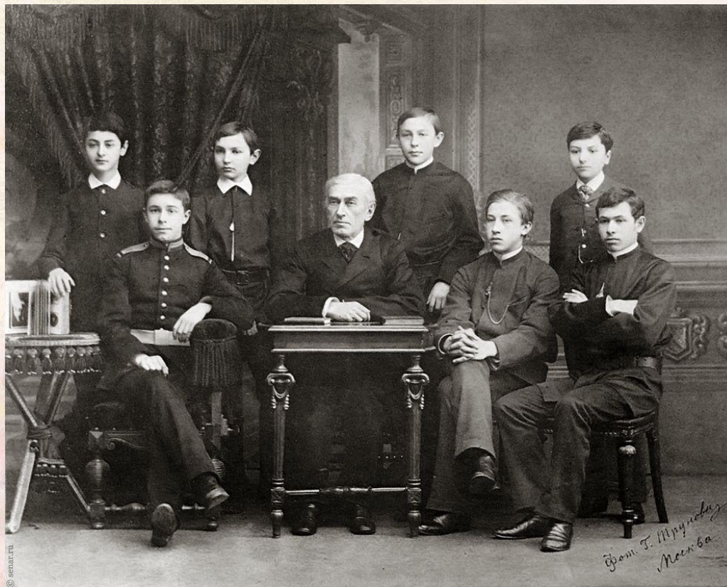
Николай Зверев с учениками. Александр Скрябин (слева, сидит), 1888 г.

Сам он вёл занятия по теории композиции. Танеев не только оценил способности мальчика, но и искренне полюбил его.