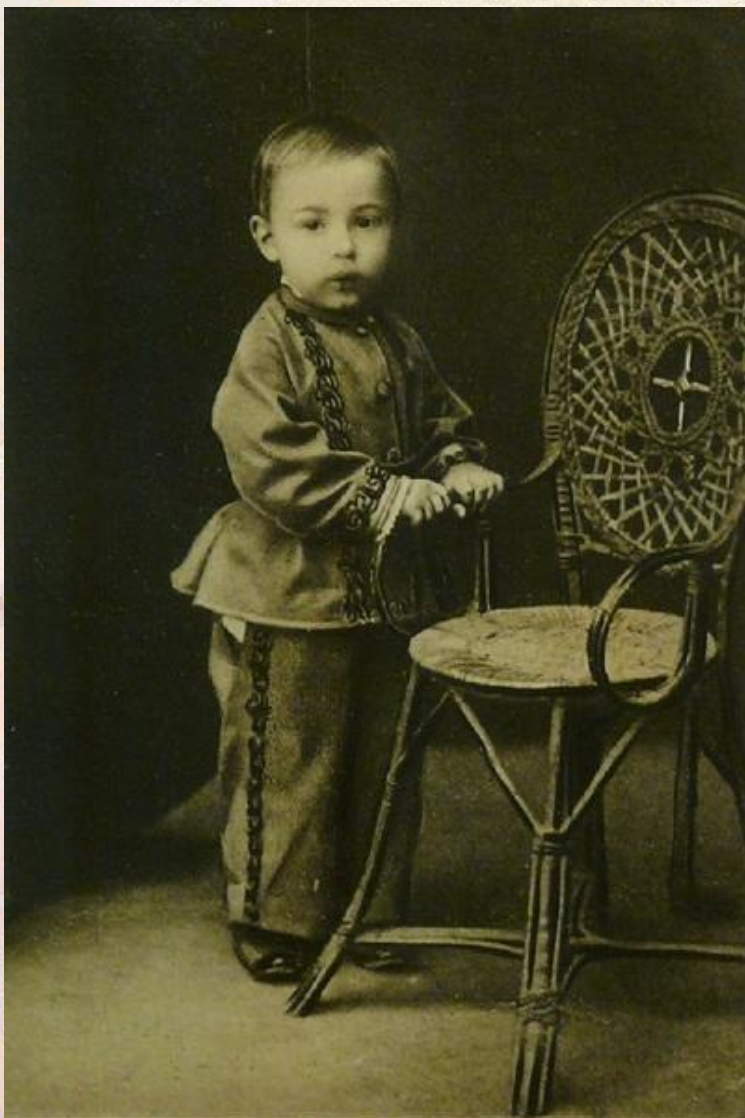
Саша Скрябин в возрасте полутора лет, 1873