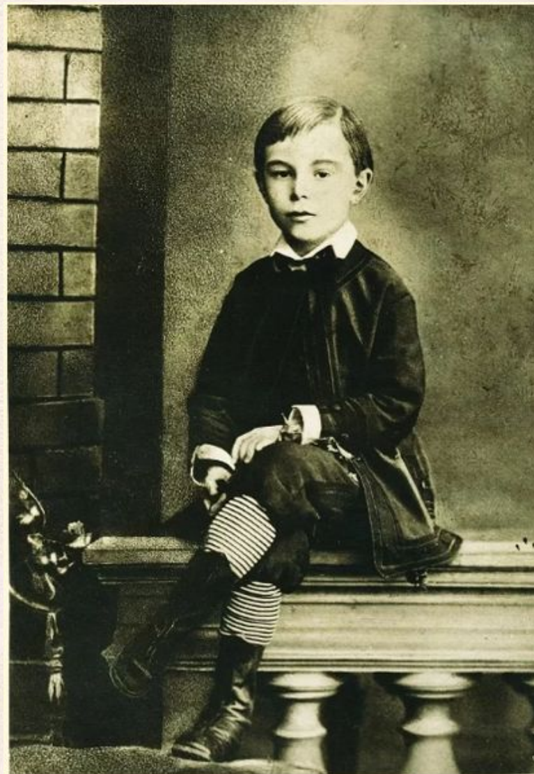
Скрябин А. Н. в возрасте 7-ми лет, 1879