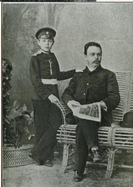
А. Н. Скрябин-кадет с отцом Н. А. Скрябиным. 1882

На это же время пришлось и его дебютные композиторские опыты — в основном фортепианные миниатюры. На творчество Скрябина в то время повлияло увлечение Шопеном, он даже спал с нотами известного композитора под подушкой.