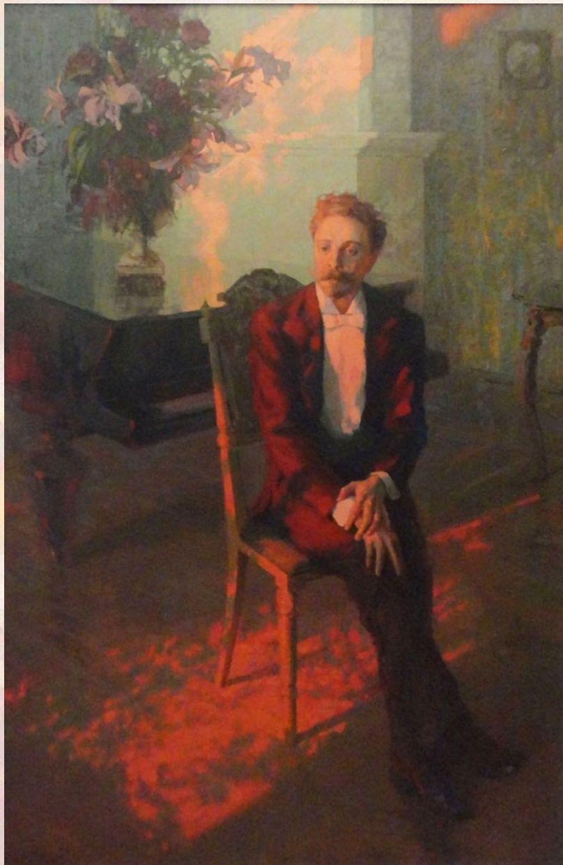
Александр Пирогов. Портрет Александра Скрябина. XX век.

Первые месяцы 1915 года Скрябин много концертировал. В феврале состоялись два его выступления в Петрограде, имевшие очень большой успех. В связи с этим был назначен дополнительно третий концерт на 15 апреля в Малом зале Петроградской консерватории. Этому концерту суждено было оказаться последним.