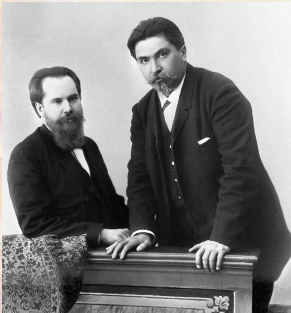
Композитор Сергей Иванович Танеев (1856-1915) и дирижер, директор Московской консерватории Василий Ильич Сафонов (1851-1918)

В 1888 году, за год до окончания кадетского корпуса, Александр Скрябин стал студентом Московской консерватории по классу композиции и фортепиано.