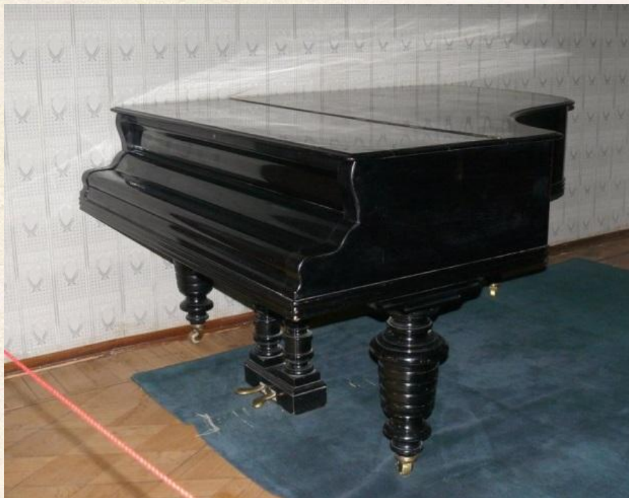
Рояль Беккер кабинетный, подарен А. Н. Скрябину М. П. Беляевым в 1895 г.

В этом же году Александр Скрябин занялся преподаванием: ему был необходим стабильный источник дохода, чтобы содержать семью. В 26 лет он стал профессором фортепианного класса Московской консерватории.