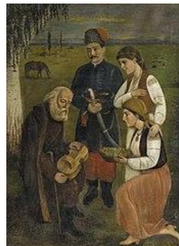
«Дума про Україну»