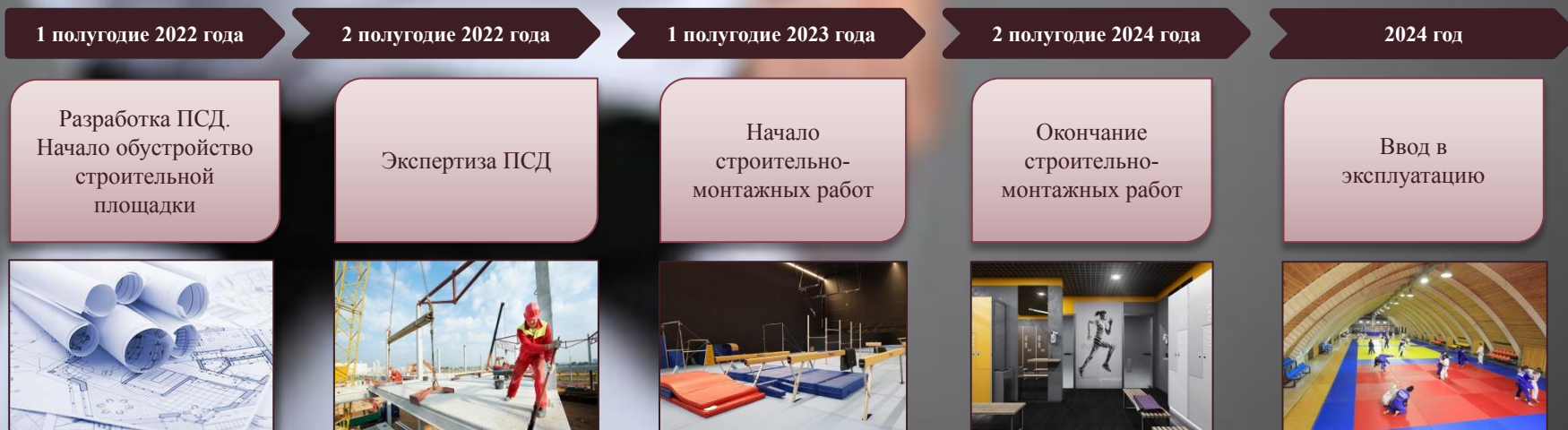
График реализации проекта.