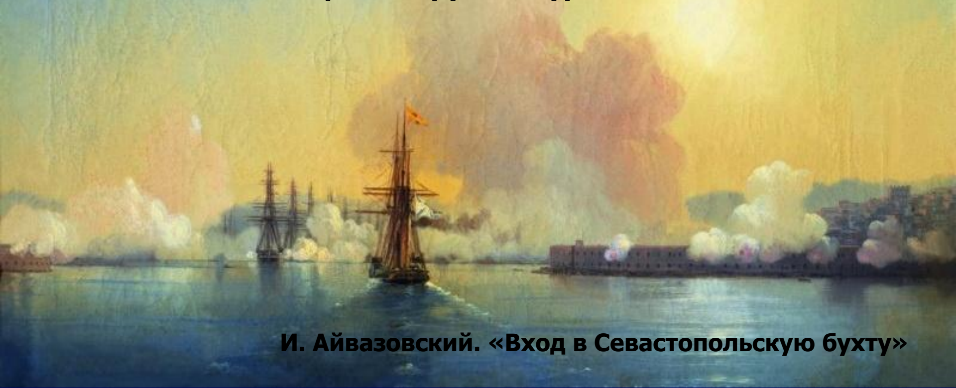
И. Айвазовский. «Вход в Севастопольскую бухту»

Крым не раз становился ареной ожесточенных битв и сражений. Самая кровопролитная война XIX столетия в России получила название Крымской (1853 – 1856 гг.). Это была очередная русско-турецкая война.