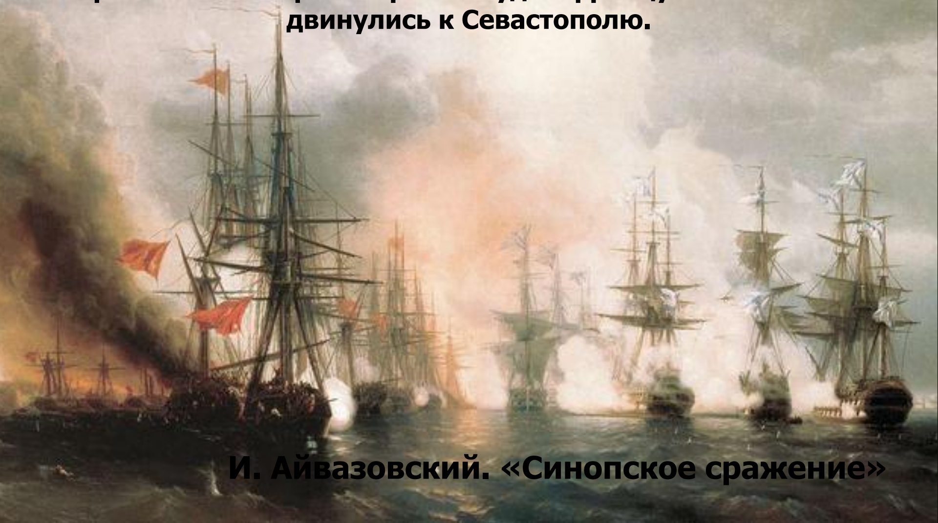
И. Айвазовский. «Синопское сражение»

Сначала Русская армия и флот одержали ряд побед на суше и на море. Тогда на стороне Турции выступили Англия и Франция, недовольные усилением роли России в этом регионе. Положение России резко осложнилось. 89 военных кораблей и 300 транспортных судов французов и англичан двинулись к Севастополю.