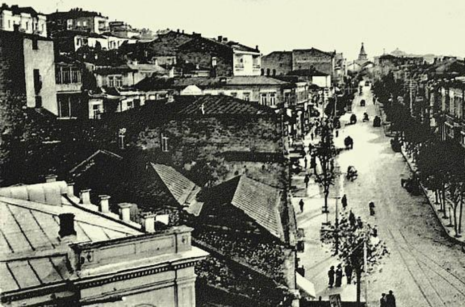
Севастополь. Б. Морская улица. SÉBASTOPOL. Grand Rue de la Mer.