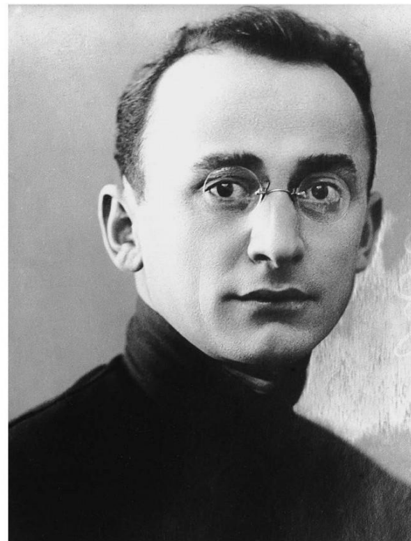
Л.П. Берия. Фотография. 1930-е гг.