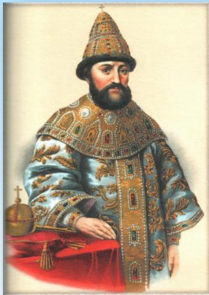
Михаил Фёдорович Романов

Объединение русского народа вокруг Минина и Пожарского, освобождение Москвы дало толчок для развития государственности, начало становления мощного российского государства, которое стало Российской империей.