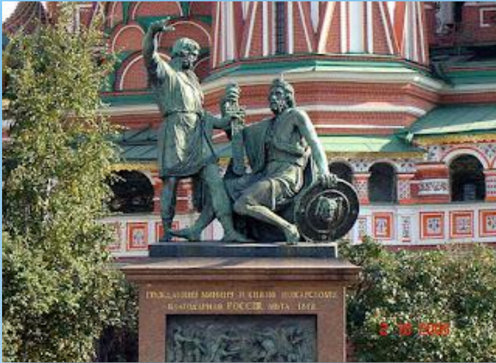
Памятник Кузьме Минину и Дмитрию Пожарскому в Москве

20 февраля 1818 года в Москве был открыт памятник Минину и Пожарскому (по проекту скульптора И. П. Мартоса) - один из самых известных памятников Москвы. Он создавался с 1804 по 1815 гг. на народные пожертвования и был установлен на Красной площади напротив входа в Верхние торговые ряды. На его пьедестале отлиты две бронзовые картины с выпуклыми изображениями (барельефами).