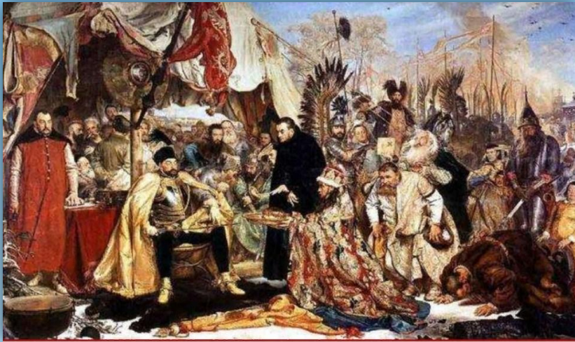
Смутное время 1598-1613 гг.