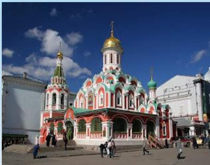
Казанский собор в Москве

Храм-памятник во имя Казанской иконы Божией матери, с которой связывалось избавление России от польского нашествия, был построен на средства первого царя династии Романовых Михаила Федоровича и освящен в 1636 г.