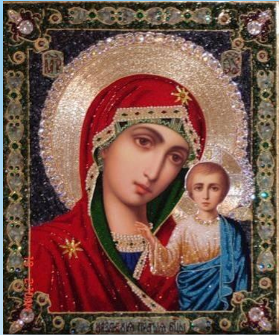
Казанская икона Божией Матери

Уверенность, что благодаря именно иконе Казанской Божией Матери, была одержана победа, была столь глубока, что князь Тожарский на собственные деньги специально выстроил на краю Красной площади Казанский собор.