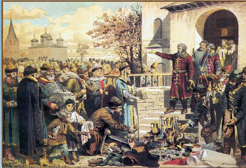
Минин на площади Нижнего Новгорода, призывающий народ к пожертвованию.