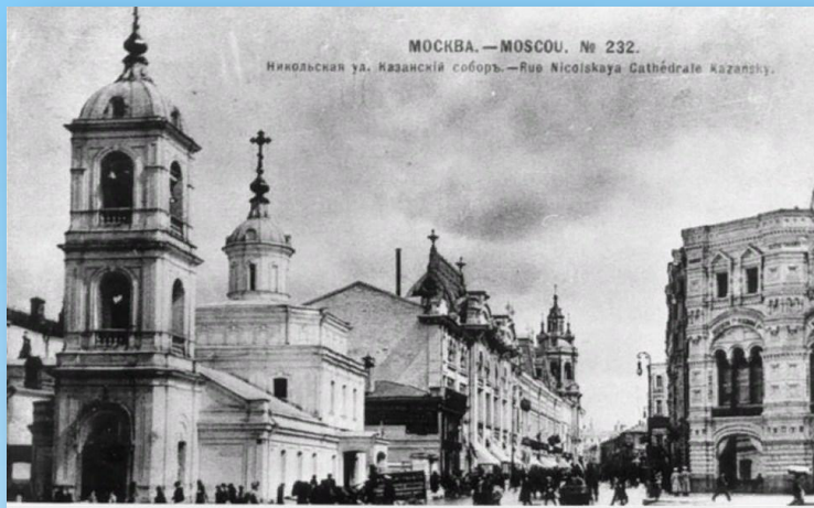
Казанский собор в старину.