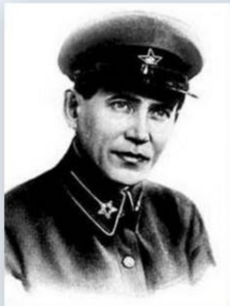
Николай Ежов председатель НКВД, расстрелян в 1940 г.