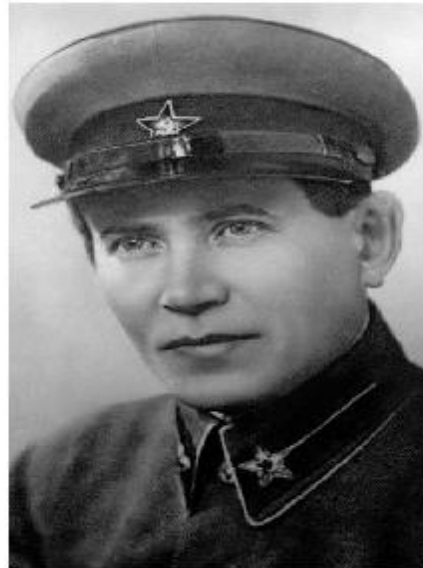
Н.И. Ежов (1936-1938 гг.)