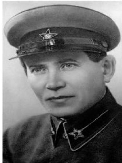
Н.И. Ежов (1936-1938 гг.)