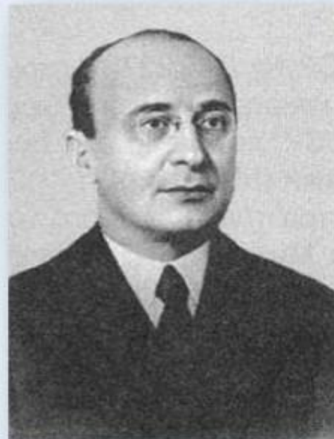
Лаврентий Берия, председатель НКВД, расстрелян в 1953 г.