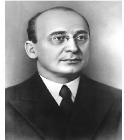
Л.П. Берия (1938 – 1953 гг.)