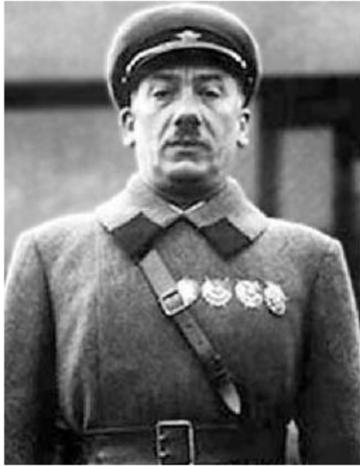
Г.Г. Ягода (1934-1936 гг.)