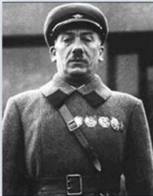
Генрих Ягода, создатель системы ГУЛАГ, расстрелян в 1938 г.