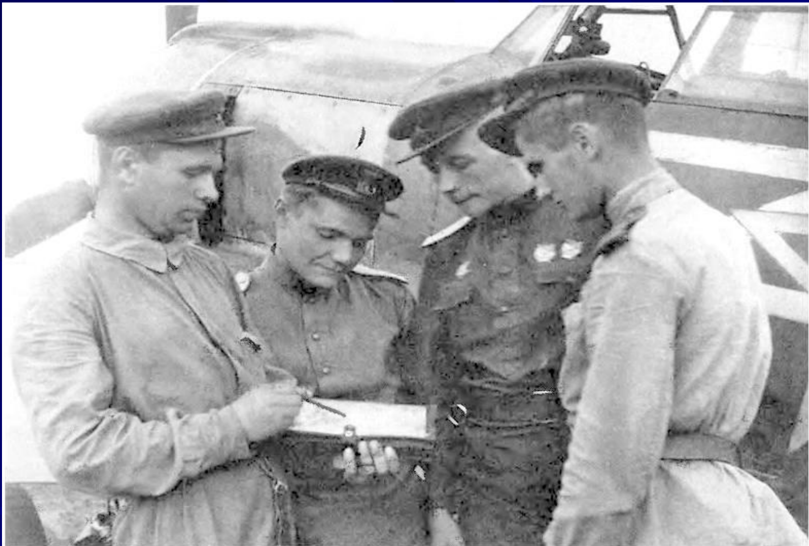
Командир эскадрильи 31-го истребительно-авиационного полка Н.М. Скоморохов ставит задачу летчикам эскадрильи