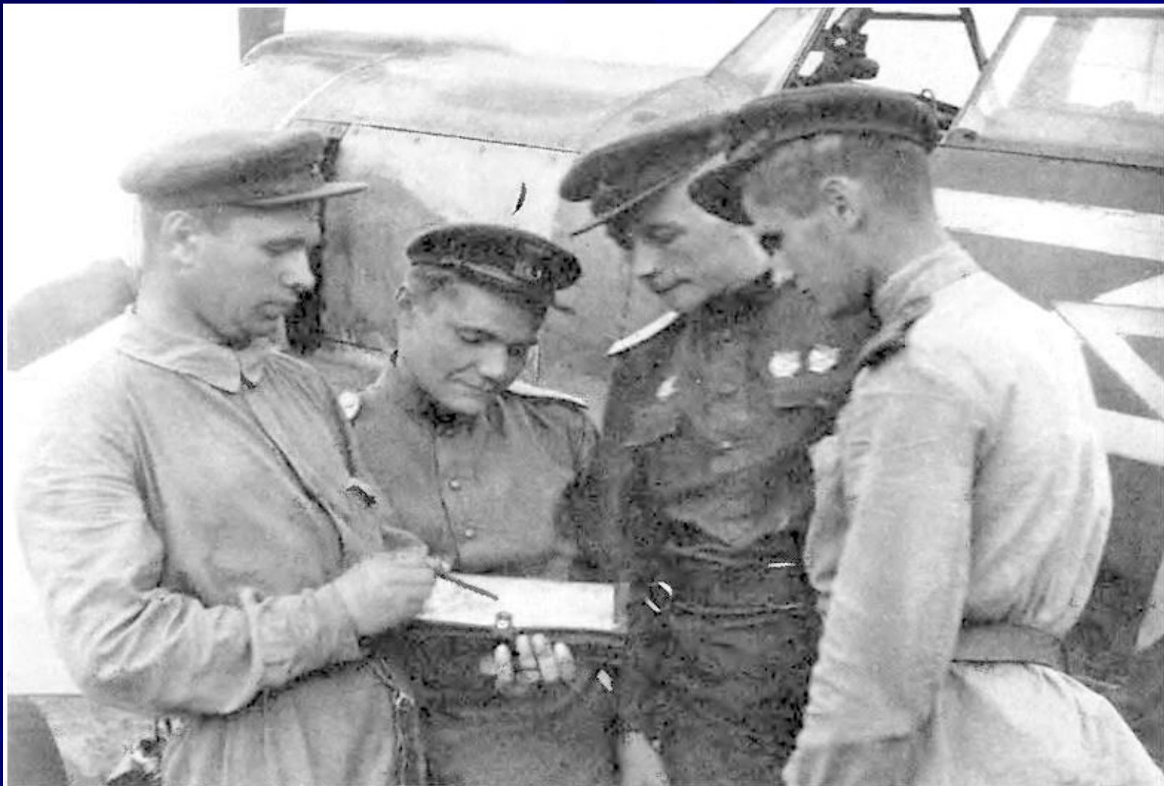
Командир эскадрильи 31-го истребительно-авиационного полка Н.М. Скоморохов ставит задачу летчикам эскадрильи