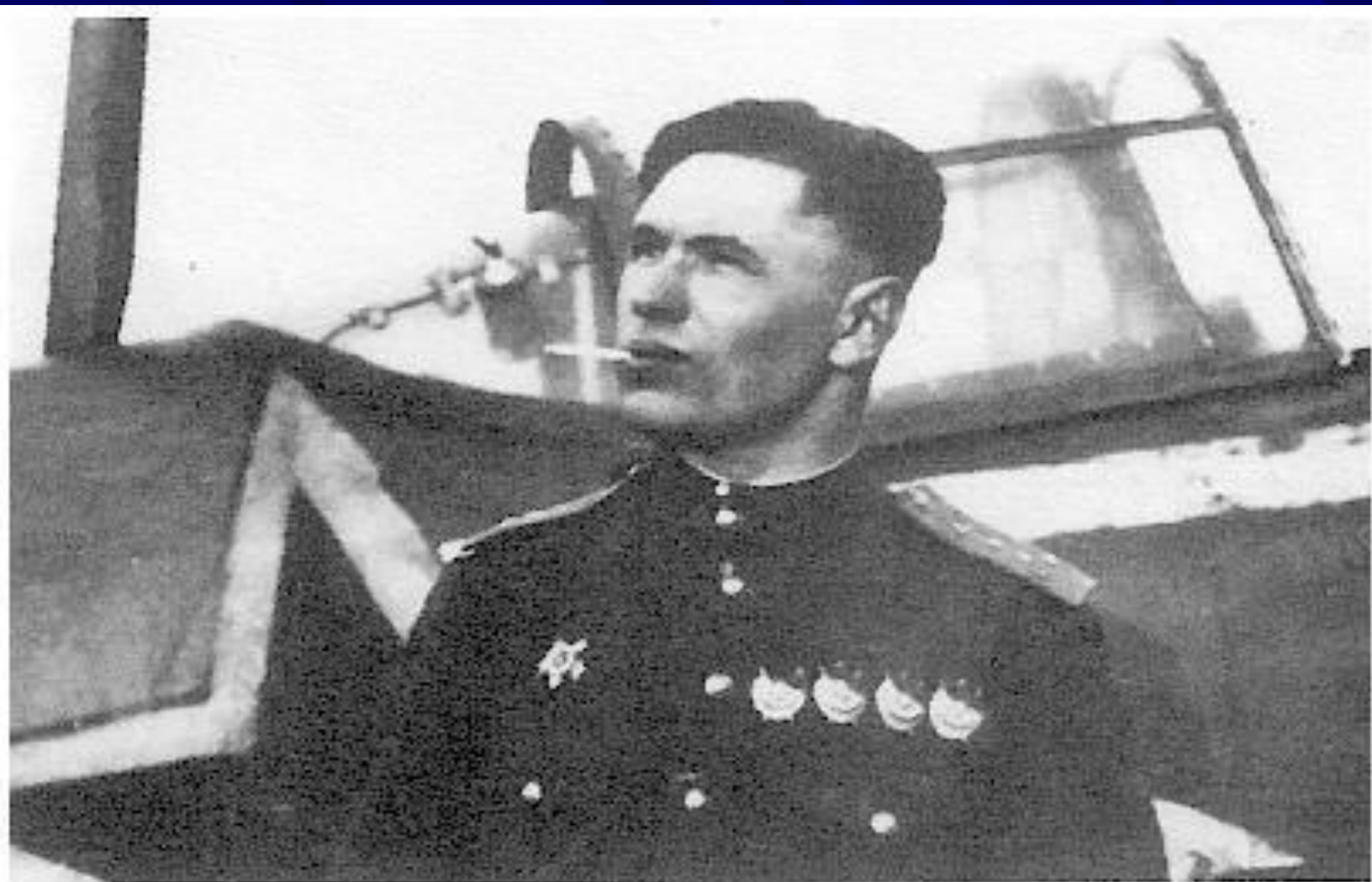
Николай Скоморохов у самолета Ла-5