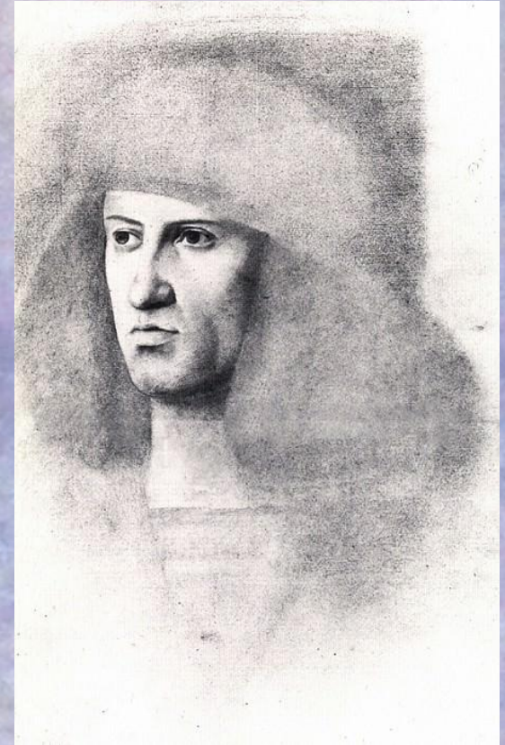
Эдгар Дега – Джентиле Беллини, этюд