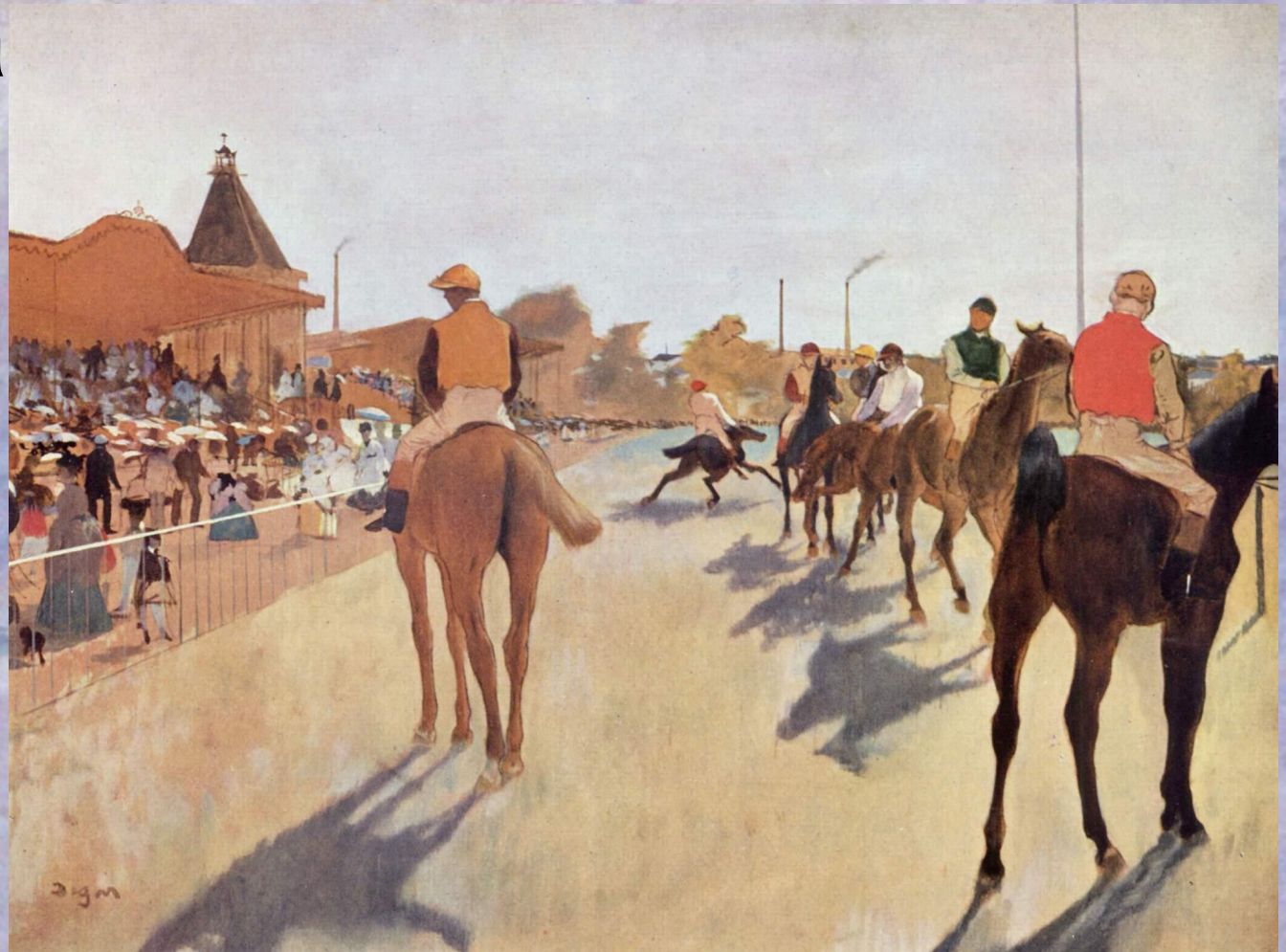
«Скаковые лошади перед трибунами» 1869—1872 г. Музей Орсе, Париж.