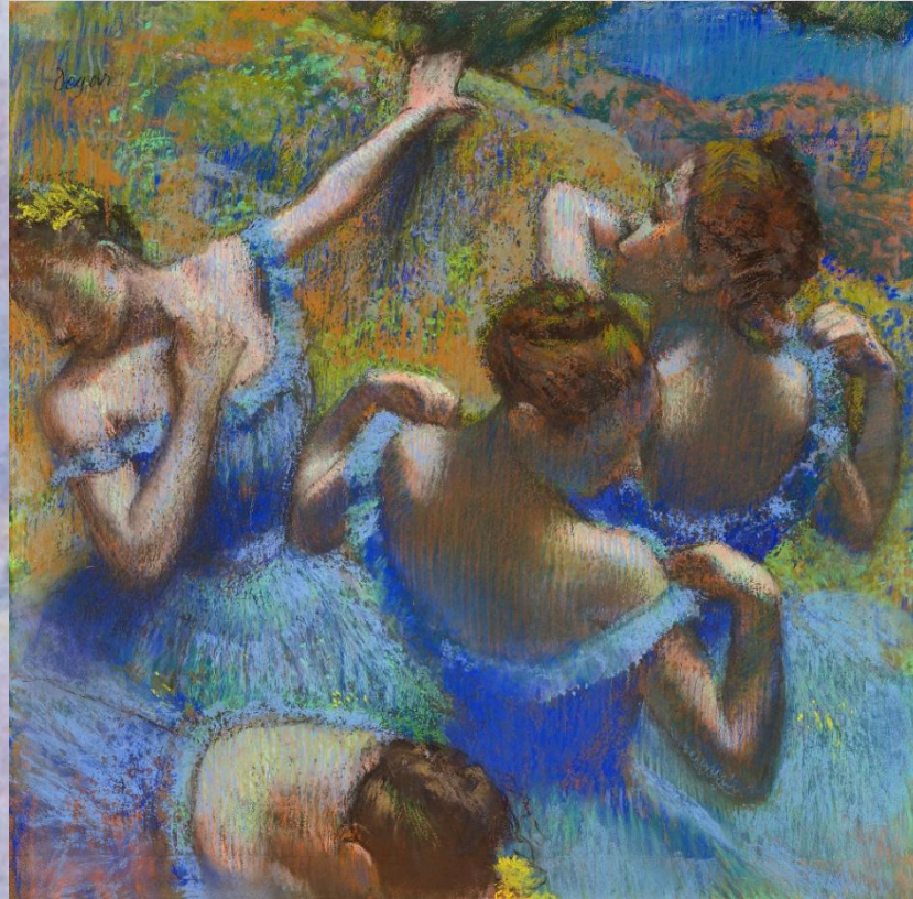
«Голубые танцовщицы» (1897), Музей искусств им. А.С.Пушкина, Москва